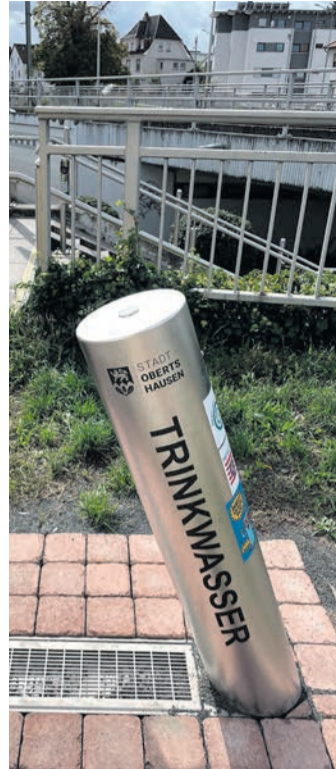
Einer von vier Standorten von Trinkbrunnen: am Busbahnhof.

Die Stadt plant, sich mit den Brunnen der Refill-Kampagne des Kreises Offenbach anzuschließen. Die Refill-Initiative ermöglicht es Bürgerinnen und Bürgern, ihre mitgebrachten Trinkflaschen kostenlos