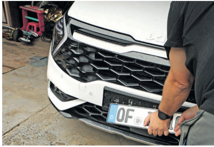
Die Stadtverordnetenversammlung setzt sich für ein Rödermark-Kennzeichen ein. Für die vorschnelle Demontage der OF-Nummernschilder ist es aber noch zu früh, bis zu einer möglichen Umsetzung werden noch einige Jahre ins Land gehen.

Der CDU-Fraktionsvorsitzende Michael Gensert unterstützte