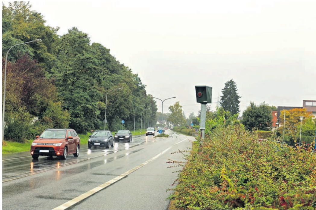
In Waldacker soll es bald wieder einen funktionierenden Blitzer geben.