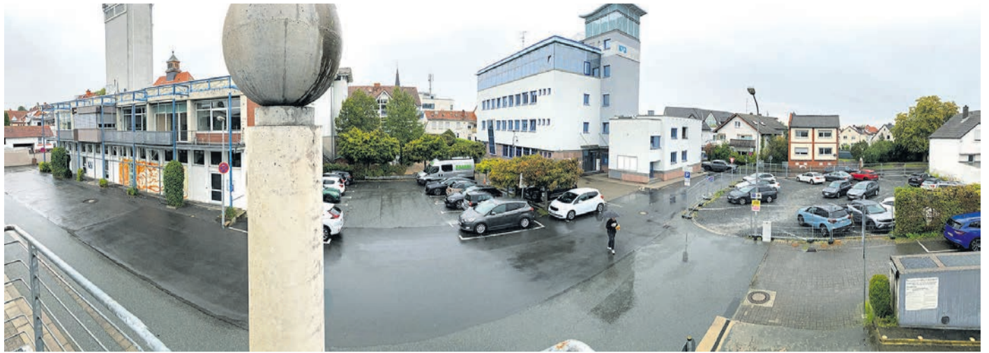
Ein „Herzstück“ bei der Umgestaltung Rödermarks: Der Bereich um die Kulturhalle wird Gegenstand eines Wettbewerbs.