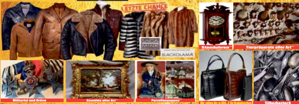
Militärat und Orden, Gemälde aller Art, Porzellanpuppen, Wir zahlen bis zu 800,- € für Brillenfasschen, Silberbesteck

Ankauf von Lederjacken, Ledermäntel und Lederhosen aus Glatt- und Wildleder, auch Lammfellmäntel zum Höchstpreis bis zu 3.500 €*