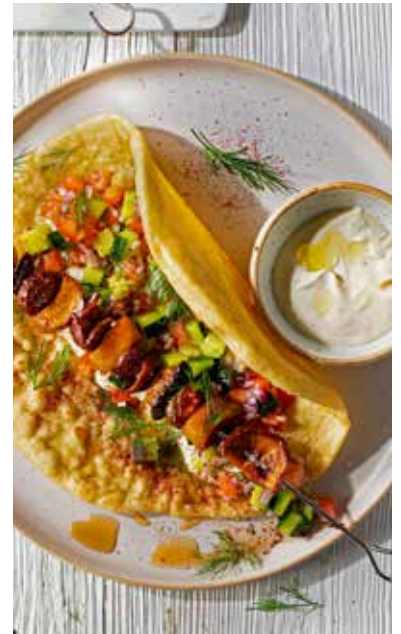
Pilze mal ganz anders: Ahorn-Pilz-Schawarma im Pitabrot mit Salat und Joghurt-Dip.

Genießer-Tipp: Mit Ahornsirup lassen sich weitere herbstliche Leckerbissen kreieren wie Ahorn-Pilz-Schawarma im Pitabrot, Zitronen-Steaks mit Ahorn-Frucht-Chicorée oder gerösteter Chinakohl mit Ahorn-Essig. Diese und andere Rezeptideen gibt es unter www.ahornsirup-kanada.de/rezepte . Auf der Website finden sich außerdem Tipps, welche Sorte zu welcher Mahlzeit passt.