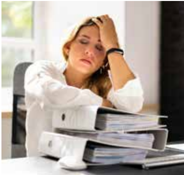
Digitaler Dauerstress gehört zu den häufigsten Triggern für Kopfschmerzen und Migräne.

Umfrage: Wie Klima und Digitales unser Wohlbefinden beeinflussen