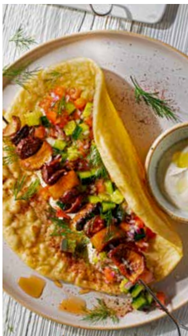
Pilze mal ganz anders: Ahornpilz-Schawarma im Pitabrot mit Salat und Joghurt-Dip.