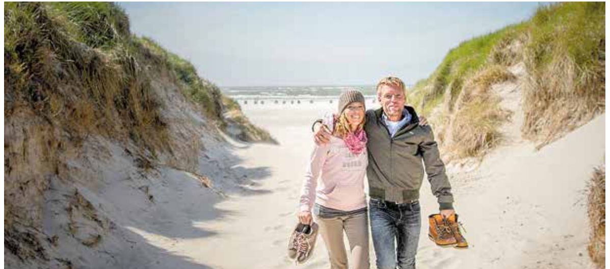
Den Sand an den Füßen spüren: Impressionen von einem herbstlichen Spaziergang auf Amrum.

Auf Amrum eröffnet sich im Herbst eine vielfältige Klangwelt: Das beruhigende Rauschen der Wellen und die stetige, lebendige Brandung, das Kreischen der Möwen, das an die Nähe zum endlosen Meer erinnert. Dazu kommt das