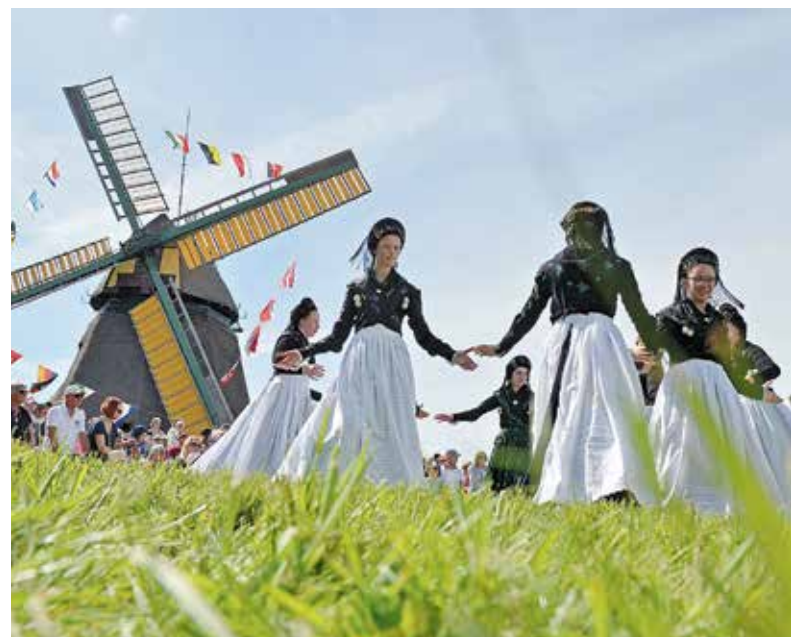
Friesentracht und -tanz werden von der regelmäßig auf der Insel auftretenden Amrumer Trachtengruppe gepflegt.