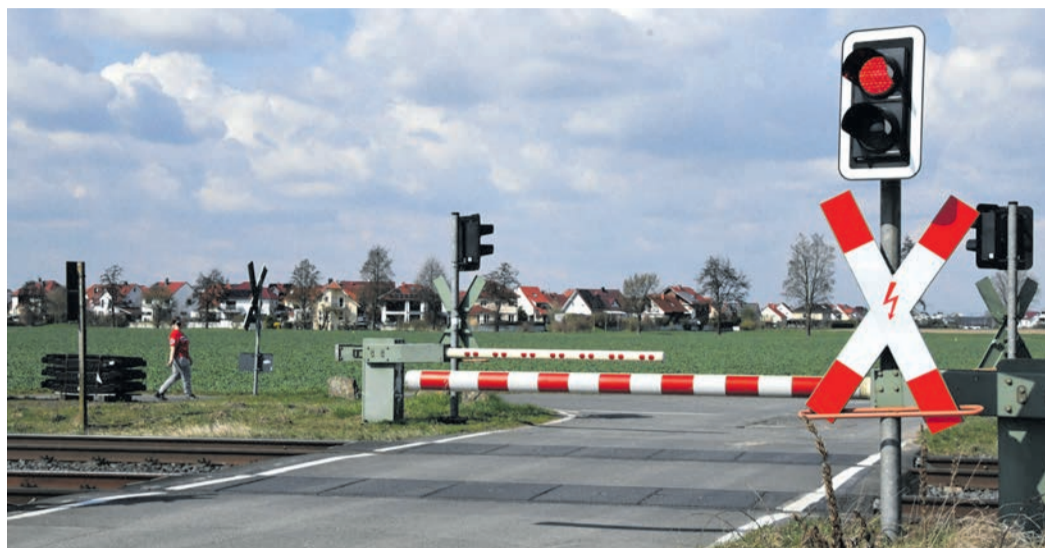
Rote Ampel für den Bau zweier Lärmschutzwände an der Bahnlinie Darmstadt-Aschaffenburg zwischen Münster und Altheim? Der HSGB hat jedenfalls das entsprechende Bürgerbegehren für zulässig erklärt, das nun in Münsters ersten Bürgerentscheid seiner Geschichte münden dürfte. Das Foto zeigt den Bahnübergang an der Straße „Außerhalb“, der Anliegern sowie Fußgängern und Radfahrern vorbehalten ist. Im Hintergrund ist das Münsterer „Inselviertel“ zu sehen.

Genau darauf zielt das Bürgerbegehren, das von drei Vertrauenspersonen aus Münster und Altheim initiiert wurde und vorangetrieben wird, ab: „Sind Sie dafür, den Beschluss der Gemeindevertretung vom 24. März zum Bau einer Lärmschutzwand aufzuheben?“, lautet die Frage, die in Bälde allen wahlberechtigten Münsterern gestellt werden soll. Dies könnte im Rahmen der Hessischen Kommunalwahlen am 15. März 2026 geschehen. Den Termin für den Bürgerentscheid muss aber noch die Gemeindevertre-