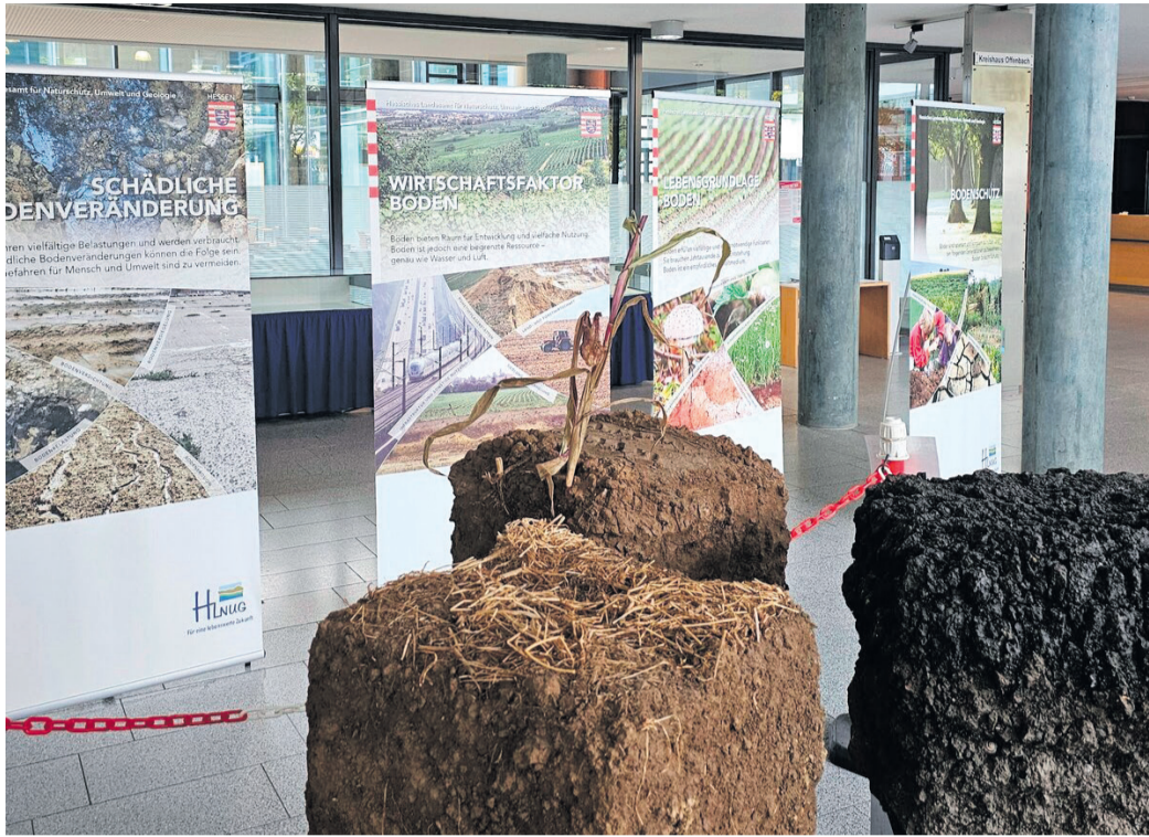
Die Ausstellung informiert nicht nur auf Roll-Ups über das Thema Böden, sondern zeigt auch imposante Exponate.

Bis zum 30. Oktober 2025 präsentiert die Ausstellung in Bildern und Texten einen Querschnitt von der Entstehung des Bodens, über seine verschiedenen Bestandteile, Profile,