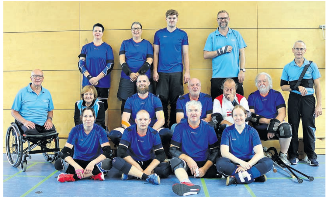
Die Sitzballer der BSG Hausen beim Turnier in Obertshausen. 3. Spielgemeinschaft Hausen/Ahnatal, 4. BSG Hemmingen, 5. SGV Dresden, 6. PluSport St. Gallen (Schweiz), 7. TSV 78 SV Stendal, 8. OSV Zittau, 9. BRS

Die Siegerehrung und ein gemeinsames Abendessen fand im Vereinsheim der Kickers Obertshausen statt. Am Samstag, 20. September, fand der 43. Deutschland-Cup mit 9 Mannschaften in Landsberg bei Halle/Saale statt. Das Team der Behinderten-Sportgemeinschaft Hause trat auch hier als Spielgemeinschaft Hausen - Ahnatal an. Nach acht spannenden Spielen musste man sich lediglich dem amtierenden Deutschen Meister aus Plauen und der Mannschaft aus Neubrandenburg geschlagen geben. So konnte wie im letzten Jahr der 3. Platz gefeiert werden. Platzierungen: 1. BRSV „Medizin“ Vogtland e.V., 2. SV Turbine Neubrandenburg,