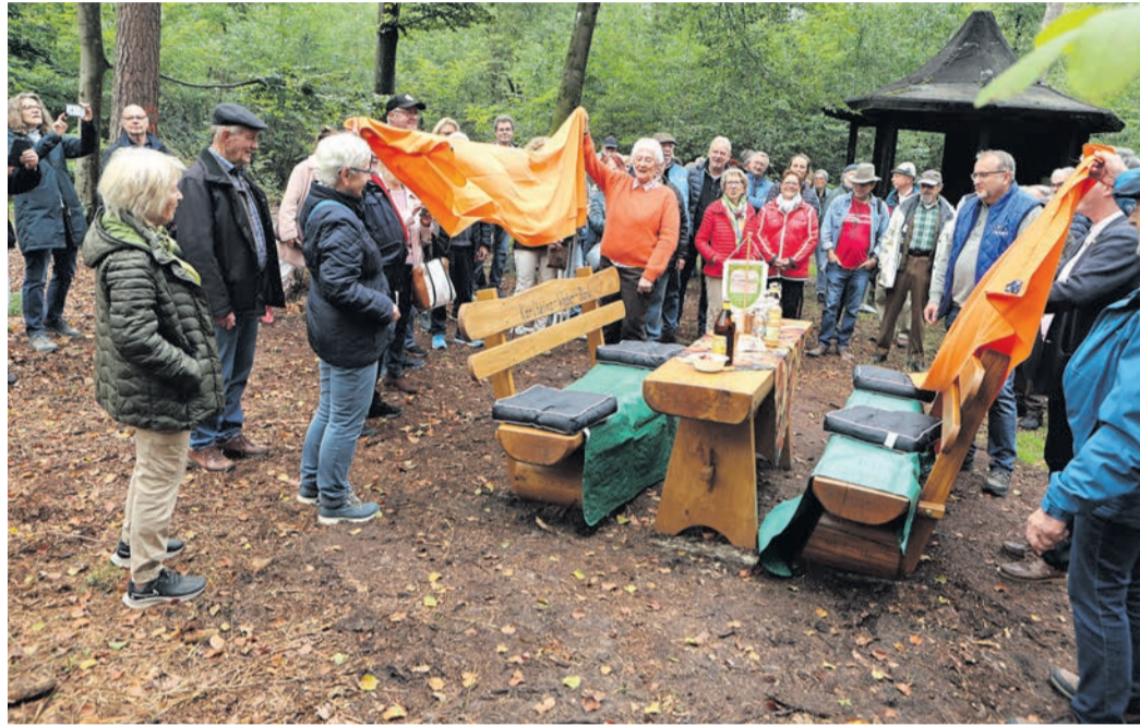
Im Rahmen einer Feierstunde wurde die Sitzgruppe mit der Karlheinz-Weber-Bank enthüllt.