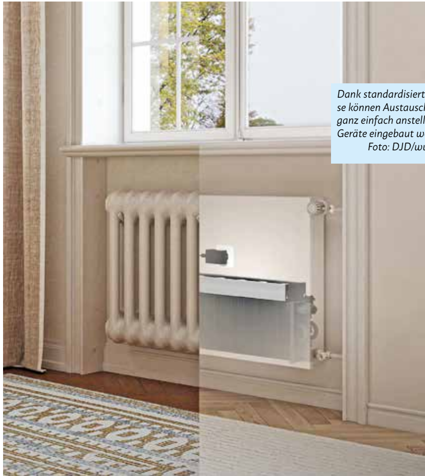
Dank standardisierter Anschlüsse können Austauschheizkörper ganz einfach anstelle der alten Geräte eingebaut werden.

Austauschheizkörper mit Lüftersystem - dem sogenannten Aktivator - ermöglichen eine Senkung der Vorlauftemperatur auf 35 Grad und damit beim Umstieg auf eine Wärmepumpe höchste Effizienz. Zusätzlich kann man mit dieser Kombination im Sommer auch ohne Kondensatbildung kühlen – mehr Informationen dazu finden sich auch unter www.jaga.com/de . Heizkörper ohne Aktivator sind für Vorlauftemperaturen ab 45 Grad geeignet. Beide Varianten arbeiten problemlos mit den verschiedensten Heizsystemen zusammen und lassen sich an unterschiedliche Anforderungen anpassen. Auch in Bestandsgebäuden können auf diese Weise ohne aufwendige Sanierung die Heizkosten deutlich gesenkt werden. (PR/DJD)