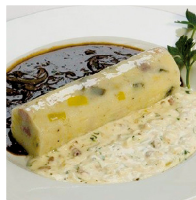
Typisch Vogelsberg: Beutelches.

Die Aktionsgemeinschaft Vogelsberger Gastronomen hat sich den regionalen Produkten und traditionellen Gerichten aus Überzeugung angenommen und interpretiert diese herzlich bis feinsinnig und bodenständig bis neu.