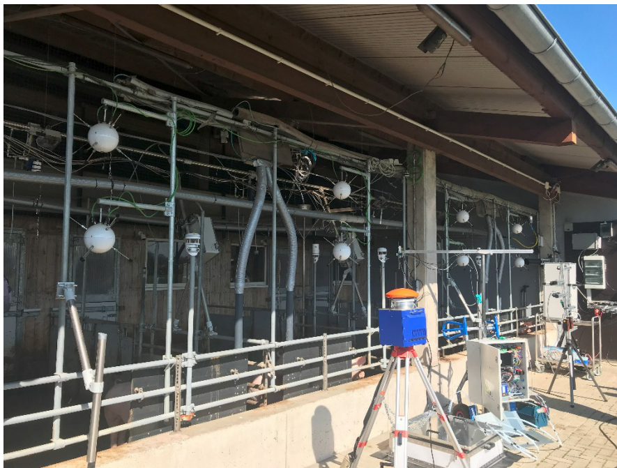
Abb. 1: Blick vom Auslauf in den Offenfrontstall am Standort Wehnen während der Messwochen

Das Projekt EmiMod ist im Juli 2023 gestartet. Mit den gemeinsamen Messkampagnen der Verbundpartner am Offenfrontstall mit Auslauf für Mastschweine (Wehnen) wurde im Herbst 2024 begonnen. Dabei wurde während der Messwochen ein Großteil der genannten Messmethoden eingesetzt (Abb. 1). Bis April 2025 wurden bereits drei mehrwöchige Messkampagnen zu unterschiedlichen Jahreszeiten und Mastzeiträumen realisiert, weitere Messkampagnen in Wehnen sind bis Ende 2025 geplant. Die Referenzmessungen an den beiden Rinderställen in Groß Kreuzt und Riswick konnten ebenfalls bereits Mitte 2024 starten. Im weiteren Verlauf des Jahres 2025 sind dann ebenfalls Messungen mit anderen Messmethoden geplant.