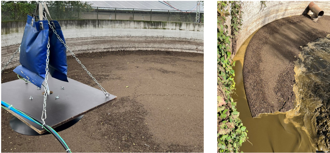
Abb. 5: Fotos eines Lagerbehälters mit einer Schwimmschicht aus separierten Feststoffen

Untersuchungen sind auch im Bereich der Lagerung von Schweinegülle erforderlich, um das emissionsmindernde Potenzial von natürlichen Schwimmschichten zu ermitteln. Vor dem Hintergrund des Umbaus der Tierhaltung zu qualitätsgesicherten, dem Tierwohl dienenden Haltungsverfahren, ist insbesondere im Bereich der Schweinehaltung mit einem vermehrten Einsatz von Häckselstroheinstreu, faserreichem Beschäftigungsmaterial und einer veränderten Fütterung zu rechnen. Diese Einsatzstoffe führen auch bei Schweinegülle zu einer vermehrten Schwimmschichtbildung.