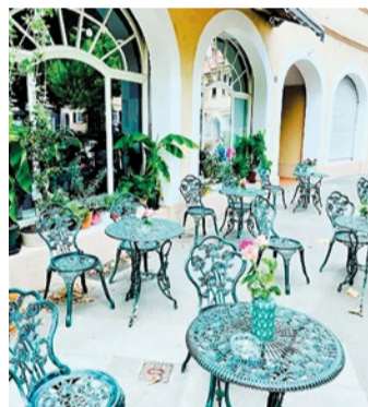
Außenbereich mit eleganter Atmosphäre – Restaurant Vier Kaiser, Frankfurt

Die Werksbrücke West ist mehr als nur eine Querung über den Main – sie steht für die enge Verbindung zwischen Sindlingen und dem Industriepark Höchst. Bereits 1912 eröffnet, diente sie zunächst ausschließlich dem Werksverkehr und war für die Öffentlichkeit nicht zugänglich. Heute ist die Brücke auch für Fußgänger und Radfahrende freigegeben und bietet einen funktionalen Übergang zwi-