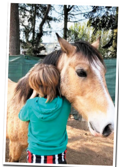
Naturerfahrung und Tiernähe – die Glückswiese in Frankfurt-Sindlingen

agogische Angebote auf einem Lebenshof vereint. Ob Reittherapie, Kindergeburtstage oder Schulprojekte – das Angebot richtet sich an Familien, Kinder und alle, die Natur erleben möchten. Pferde, Schafe, Hühner und weitere Tiere leben hier artgerecht und sind Teil des pädagogischen Konzepts. Die Glückswiese versteht sich als Lernort und Begegnungsraum, an dem Ruhe, Verantwortung und Freude im Mittelpunkt stehen. Wer in Sindlingen einen Ort sucht, der bewusst anders funktioniert und Nähe zur Natur erlebbar macht, wird hier fündig.