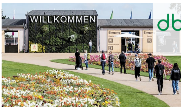
Bundesgartenschau Mannheim 2023