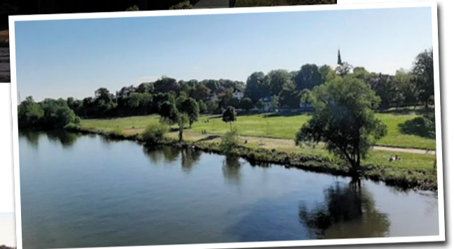
Blick von der Werksbrücke auf das ruhige Mainufer

Die Glückswiese ist ein besonderer Ort im Stadtteil: Hier werden Tiere, Natur und päd-