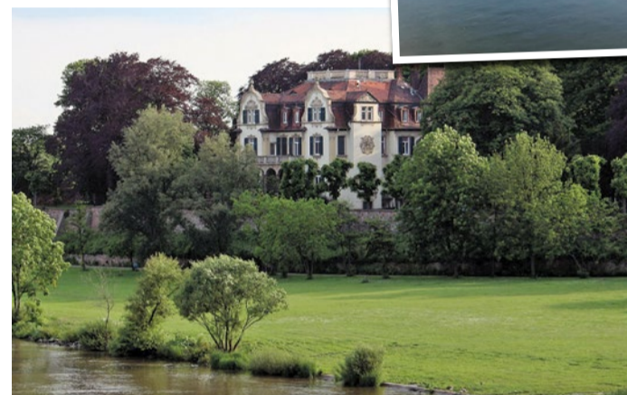
Ein echtes Schmuckstück abseits der bekannten Wege

agogische Angebote auf einem Lebenshof vereint. Ob Reittherapie, Kindergeburtstage oder Schulprojekte – das Angebot richtet sich an Familien, Kinder und alle, die Natur erleben möchten. Pferde, Schafe, Hühner und weitere Tiere leben hier artgerecht und sind Teil des pädagogischen Konzepts. Die Glückswiese versteht sich als Lernort und Begegnungsraum, an dem Ruhe, Verantwortung und Freude im Mittelpunkt stehen. Wer in Sindlingen einen Ort sucht, der bewusst anders funktioniert und Nähe zur Natur erlebbar macht, wird hier fündig.