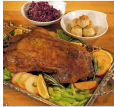
Die Weihnachtsgans mit Rotkohl und Klößen gehört für viele Menschen in Deutschland zum Fest dazu - ob zu Hause oder bei einem Besuch in der Gastronomie.

Rezeptidee: Knusprige Biergans mit Kartoffelklößen und Apfelrotkohl sowie einem frischen Bier