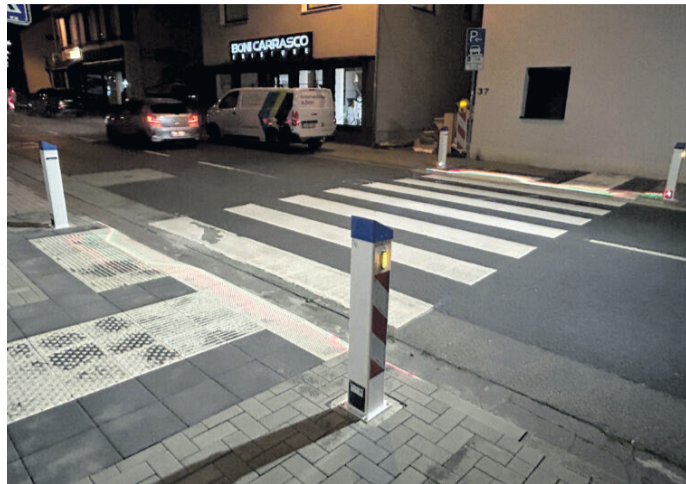
SafeXOne warnt fahrende Verkehrsteilnehmende, sobald ein Passant den Zebrastreifen betritt, mit optischen Signalen.

Die intelligenten Laser-Fußgänger-Schutzsysteme erkennen mithilfe von Sensoren, wenn sich Passanten dem Zebrastreifen nähern, und aktivieren daraufhin Lichtsignale. Bei Tageslicht leuchtet ein gelbes LED-Blinklicht auf, das Autofahrer frühzeitig warnt. „Die Straße soll für alle Verkehrsteilnehmenden sicher gestaltet sein. Fußgängerinnen und Fußgänger sind durch das LED-Blinklicht besser zu erkennen, dies steigert die Verkehrssicherheit“, erklärt Erster