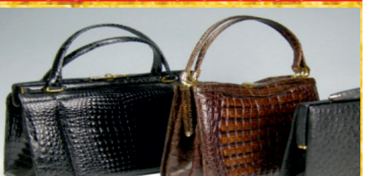
Wir zahlen bis zu 800,- € für Krokotaschen

Wir zahlen bis zu 2.500,- €** für alte Gemälde, Tierpräparate, Porzellanpuppen, Kamin + Standuhren und Porzellan