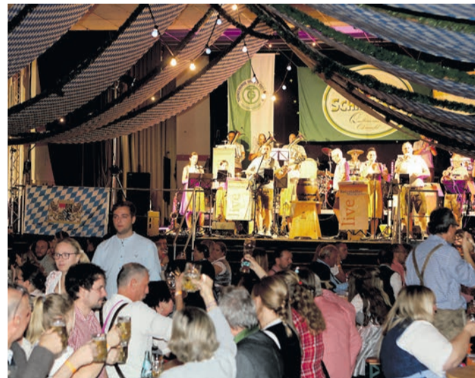
Die „Retzstadter Musikanten“ waren den ganzen Abend über im Einsatz. (Foto: PS)

TG-Oktoberfest mit viel Live-Musik und Maßkrugstemmen