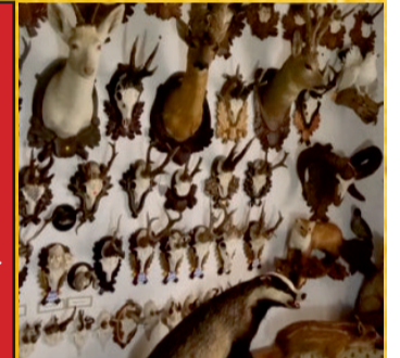
Tierpräparate aller Art**

Montag bis Freitag 10 - 18 Uhr Samstag 10 - 16 Uhr