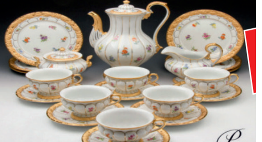
Porzellan namhafter Hersteller**