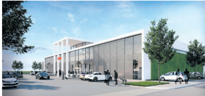
Am Rödermarkring gelegen, mit Gründach, Photovoltaik und großem Sortiment auf rund 1.600 Quadratmetern Verkaufsfläche: So könnte der neue Rewe-Supermarkt im Norden von Ober-Roden aussehen, wenn alle Planungshürden übersprungen sind und die Bauarbeiter ihren Job gemacht haben. (Grafik: Stadt Rödermark)

Rödermark (NHR) Seit über zwei Jahrzehnten wird lebhaft diskutiert: Wo könnte und sollte er denn im Stadtteil Ober-Roden vor Anker gehen, der Neubau eines modernen Supermarkts mit Vollsortimenter-Ausstattung? Kommunalpolitik, Konsumenten, potenzielle Kundschaft: Sie alle haben die Frage schon unzählige Male unter die Lupe genommen, doch ein konkretes Ergebnis kam bislang nicht zustande. Das könnte sich nun tatsächlich in absehbarer Zeit ändern. Bürgermeister Jörg Rotter informierte kürzlich in einer Magistratspressekonferenz über „ein Grobkonzept“, das der Handelskonzern Rewe und die kommunale Verwaltungsspitze angedacht haben.