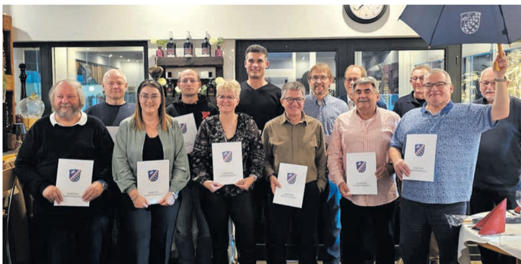
15 Personen wurden jetzt von der Gemeinde für ihren über Jahre währenden ehrenamtlichen Einsatz in den lokalen Verein gewürdigt. Der Ehrenabend der Gemeinde findet nur alle drei Jahre statt.