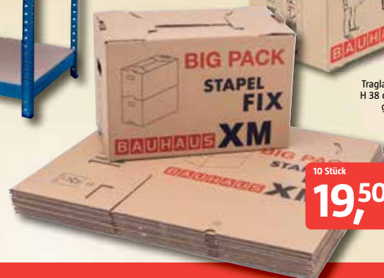
Umzugskarton 'Multibox X' Traglast 30 kg, L 62,5 x B 34,5 x H 38 cm, Volumen von 82 l, aufgedruckte Aufbauanleitung 10733102