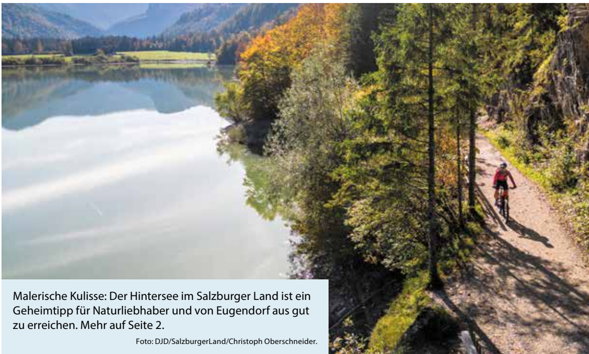
Malerische Kulisse: Der Hintersee im Salzburger Land ist ein Geheimtipp für Naturliebhaber und von Eugendorf aus gut zu erreichen. Mehr auf Seite 2.