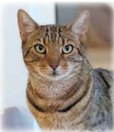
ARTGERECHT TIERSCHUTZ E. V. (PM). Unser Rio (Bengal-Mix-Kater, geboren 07/2019, kastriert) sucht

sein Glück – und vor allem sucht er die Freiheit! Er hat gerade den Freigang für sich entdeckt und genießt es sichtlich, durch die Nachbarschaft zu streifen. Um die angespannte Atmosphäre zu Hause zu entspannen, wurde Rio der Freigang ermöglicht. Dort lebt er mit seiner Schwester zusammen und harmoniert gerade nicht so gut. Früher haben sich die beiden wunderbar verstanden, doch inzwischen kracht es immer häufiger zwischen ihnen. Das sorgt für Stress bei allen Beteiligten.