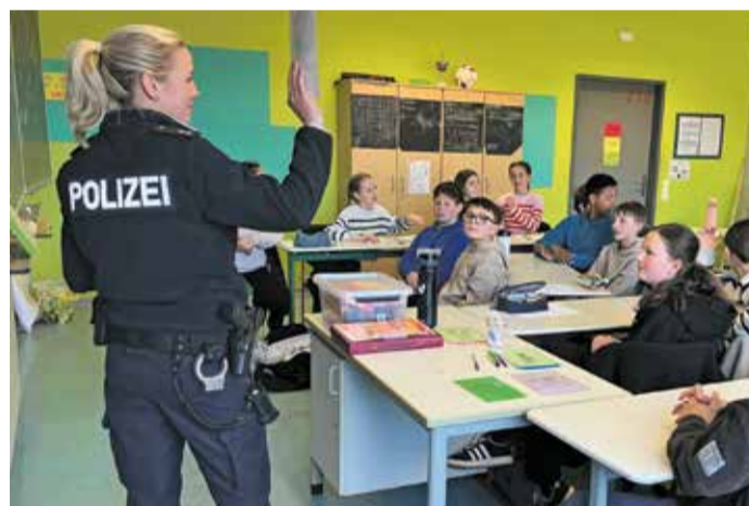
Die Schüler der Klasse 6f im Gespräch mit der Polizei im Rahmen der Suchtprävention an der GAZ.

rechtliche Hintergründe, Strafverfahren, Gesetze und erhielten Einblicke in die Arbeit der Polizei, der Jugendgerichtshilfe und der Suchtberatungsstelle des DRK Odenwaldkreises. Ziel des Projektes ist es, Jugendliche möglichst früh über Drogenkonsum aufzuklären. red