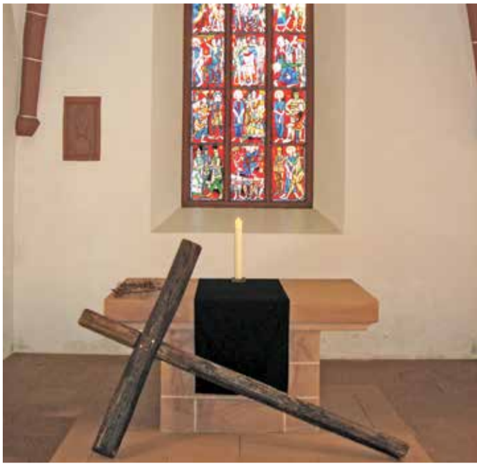
Evangelische Michaelskirche Reichelsheim.