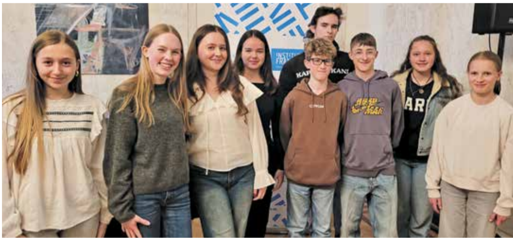
Die Schüler der GAZ bei der mündlichen DELF-Prüfung in Mainz.