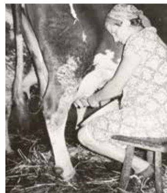
Sigrid Rummel melkt auf althergebrachte Art.