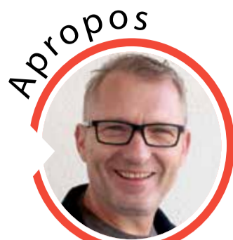
von Volker Zaborowski, Chefredakteur