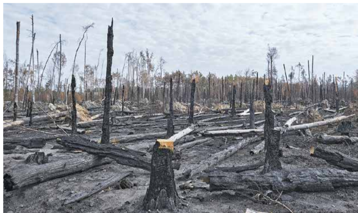
Ein Anblick der Zerstörung: So sah es nach dem Waldbrand bei Dieburg/Münster 2022 aus.

Odenwaldkreis: Zwei Drittel weniger Regen als im Vorjahresmonat