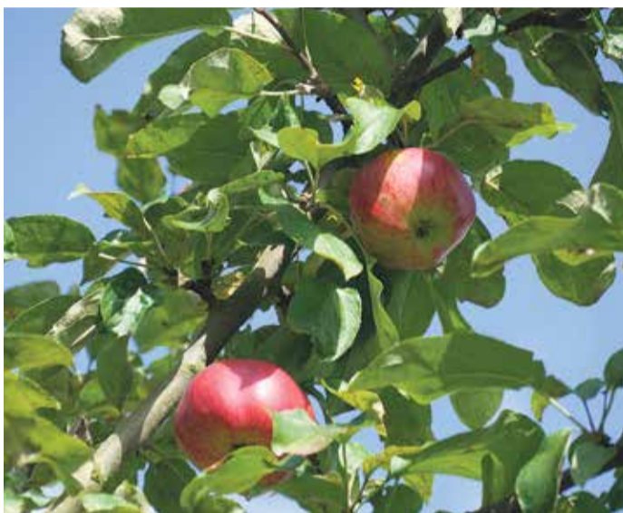
Der Frankfurter Apfel.

stellung erfahren die Gäste am 25. April mehr zu den Zielen und Aufgaben eines UNESCO Global Geoparks. red