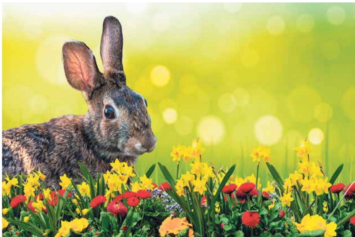
Frohe Ostern: Mit den Symbolen des Lebens geht es in den Frühling.