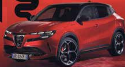
Abbildung zeigt versionsabhängige Sonder-/Ausstattungen.