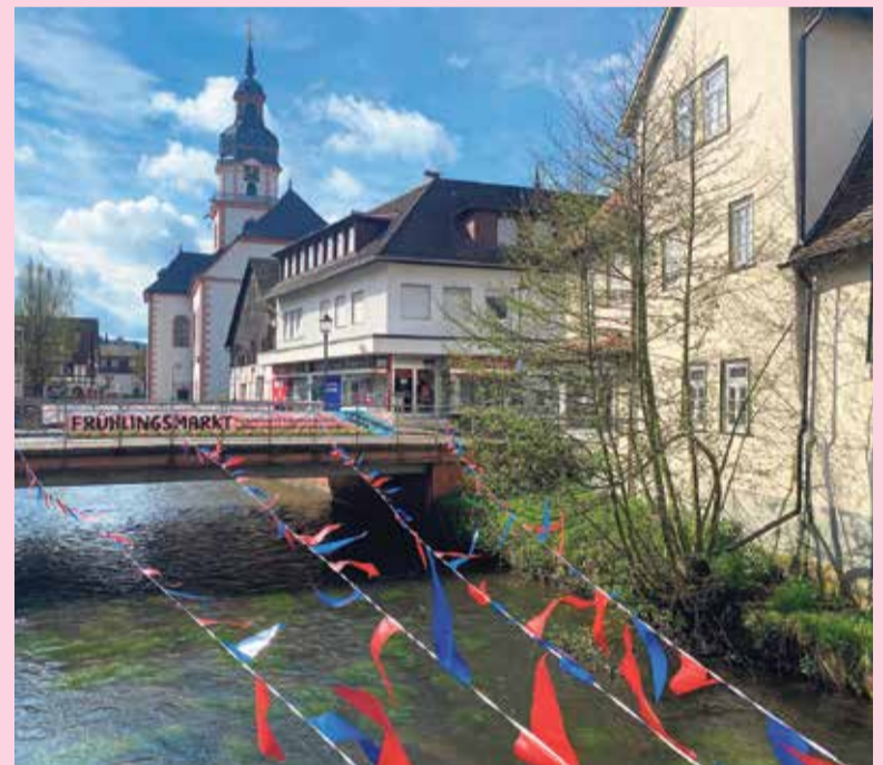
Der Erbacher Frühling lockt mit Fischfest und Frühlingfest mit verkaufsoffenem Sonntag im April nach Erbach.

Auf das Straßenfest und die Automobil-Ausstellung muss verzichtet werden. Die „Erbachs lebendiges Wasser“ zeigt am 27. April ab 15.30 Uhr, welche Geschöpfe in der Mümling leben und wie die Wasserversorgung in früheren Zeiten funktionierte. Anmeldung zur Führung bei der Touristik-Information. Wer noch österliche Stimmung genießen will, geht am Samstag, 19. April, zum ersten Schlossmarkt des Jahres. Im Lustgarten werden um 14 und 16 Uhr „Ostereier“ für Kinder verteilt. red