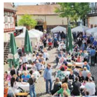
Reger Andrang bei der Veranstaltung „andere Länder, andere Freizeiten“, die nun Teil des „All in“ ist.

komplette Programm ist auf www.lebenswert-odw.de zu finden. red