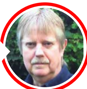
von Dr. Detlef Eichberg

sich allerdings mitunter schon als recht steinig erweisen, da konnte ich mit positiven Einreden kaum etwas entgegen setzen. Nur spürte ich in Krisen immer wieder dieses „Dennoch“, das sich aus meiner Erfahrung am Frühstückstisch in der Kleinkind-Zeit speiste. Ganz klar bedrohen uns aktuell weltweite Damoklesschwerter in Bereichen wie Krieg, Armut, Hunger, Wirtschaftskrise etc. Dennoch versuche ich, mich vor dem Dauerbeschuss mit negativen Einreden mit den schlimmsten Szenarien für die nahe Zukunft etwas zu schützen. Ich nehme nämlich nachfolgend zu den in allen möglichen Medien proklamierten pechschwarzen Wolken am Horizont eine kaum mehr zu relativierende Angst bis Verzweiflung wahr, die ein Gottvertrauen in eine vielleicht auch wieder positive Entwicklung schier verunmöglichen. Ich denke, wir sollten aufpassen, dass wir nicht von der Haltung „Wenn ich das Schlimmste befürchte, werde ich nicht enttäuscht werden“ suggestiv fremdbestimmt werden. www.detti-lama.de