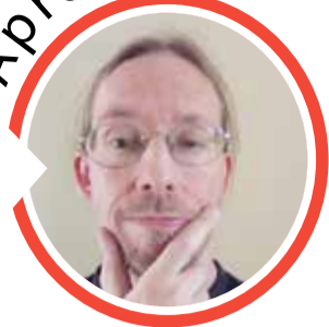
von Sven Iwertowski, Redaktionsleiter