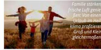
Familie stärken, frische Luft genießen: Von einem Urlaub im Heilklima profitieren Groß und Klein gleichermaßen.