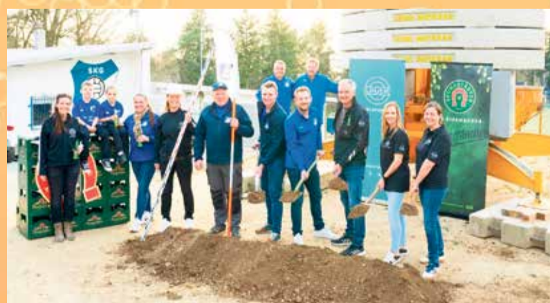
Große Freude über den Bau der Soccerhalle bei der SKG Ober-Beerbach, Lauer GmbH und Die Biermacher GmbH.