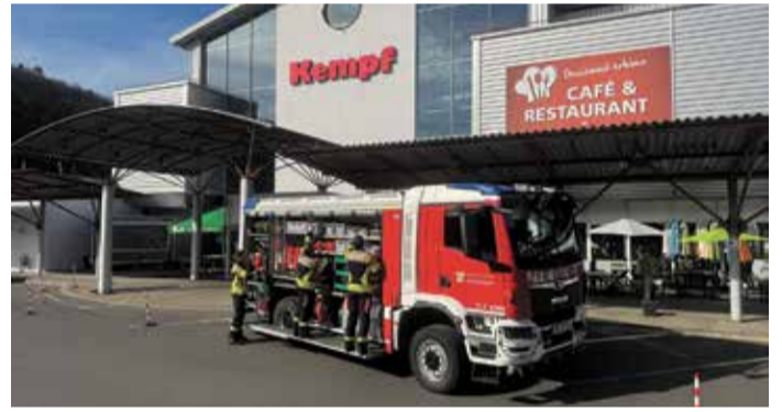
Die Feuerwehr hatte einiges zu tun.

Möbel Kempf im Räumungsverkauf sparen. Neben vielen einzelnen Möbelstücken wie Betten, Couches, Esszimmermöbel sowie zahlreiche Kleinmöbel muss auch das gesamte Küchenstudio geräumt werden. Deshalb werden alle Musterküchen abverkauft. Vom kompakten Küchenblock bis zur luxuriösen Einbauküche ist alles dabei, Elektrogeräte gibt es zum 1/2 -Preis. Die Möbelstücke sind in einwandfreiem Zustand, müssen jedoch kurzfristig weichen, weshalb Kunden sich auf starke Rabatte freuen können – Top-Qualität und namhafte Marken zu Tiefpreisen! Was weg ist, ist weg: Schnell sein lohnt sich. Es handelt sich bei den angebotenen Möbeln größtenteils um Einzelstücke. Sobald ein Stück verkauft ist, ist es weg – Nachbestellungen sind zum Angebotspreis nicht möglich. Deshalb gilt: Wer zuerst kommt, hat die größere Auswahl. Zusätzlich zu den stark reduzierten Abverkaufspreisen gibt es für