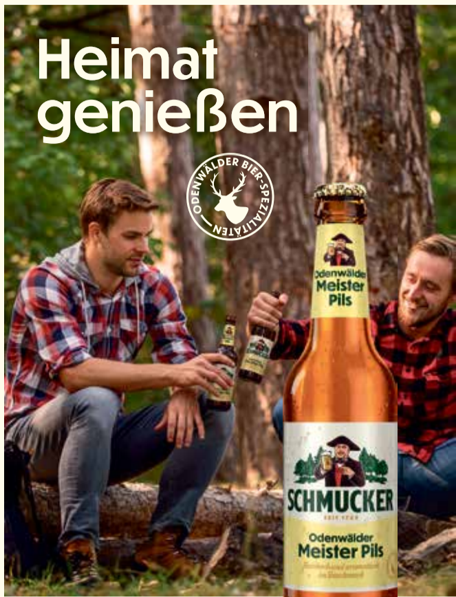
Im Odenwald zu Hause seit 1780