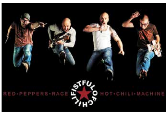
FISTFUL OF CHILI 19.30 UHR