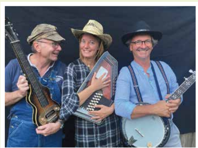
ANNIE UND DIE DALTONS 13.00 UHR

Sie finden uns auch auf dem: Michelstädter Bienenmarkt , Fürther Johannismarkt, Beerfeldener Pferdemarkt, Erbacher Wiesenmarkt, Eberbacher Kuckucksmarkt, Buchener Schützenmarkt, Erbacher Bauernmarkt, Michelstädter Weihnachtsmarkt Ihre Festbewirtung Groll freut sich auf Ihren Besuch