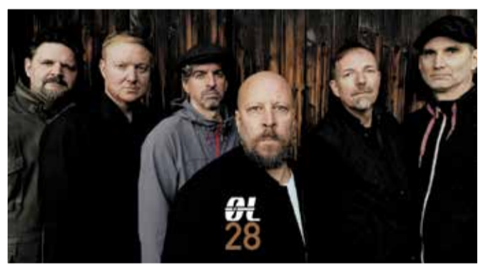
ØL 15.00 UHR