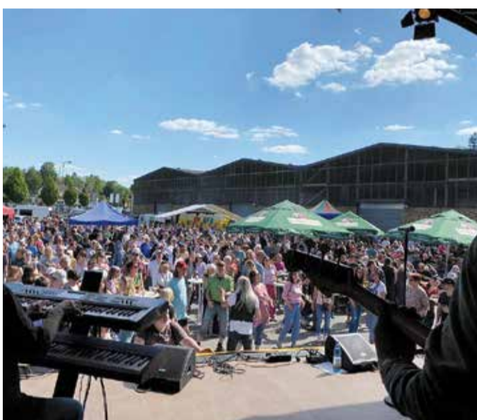
Sonnenschein zum Vatertag, dazu Live-Musik: Das Hüttenwerk öffnet an Christi Himmelfahrt wieder seine Pforten.

Odenwaldkreis. Für die nächste Woche sollten die Getränkebestände aufgefüllt und der Bollerwagen aus dem Lager geholt werden: Am Donnerstag, 29. Mai, ist nicht nur Christi Himmelfahrt, sondern auch Vatertag. Der Ursprung des Vatertags wurzelt zwar in der christlichen Tradition, im Laufe der Zeit entwickelte er sich jedoch zum „Herrentag“. Obwohl es keine inhaltlichen Zusammenhänge gibt, wurde der Vatertag vom christlichen Feiertag inspiriert: Die Himmelfahrt wurde bei den Prozessionen mit kleinen, blumengeschmückten Wagen symbolisiert. Nach der Prozession gab es meist einen kleinen Umtrunk. Daraus entwickelte