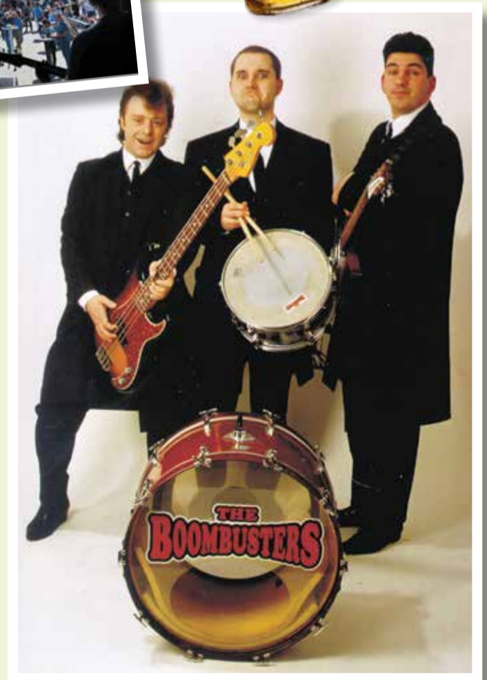
THE BOOMBUSTERS 18.00 UHR