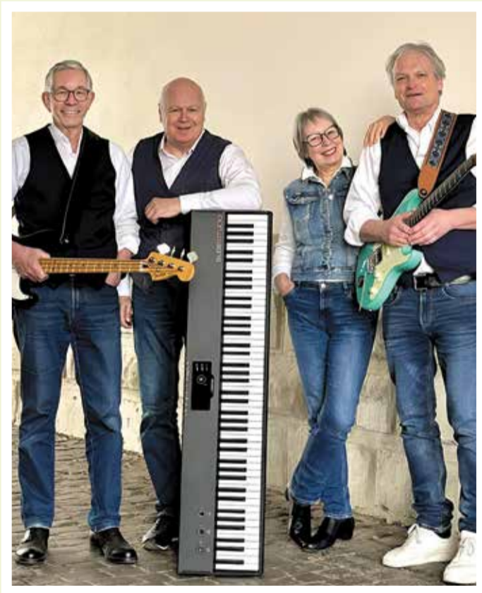
THE SEVENTIES 12.00 UHR

Sie finden uns auch auf dem: Michelstädter Bienenmarkt , Fürther Johannismarkt, Beerfeldener Pferdemarkt, Erbacher Wiesenmarkt, Eberbacher Kuckucksmarkt, Buchener Schützenmarkt, Erbacher Bauernmarkt, Michelstädter Weihnachtsmarkt Ihre Festbewirtung Groll freut sich auf Ihren Besuch