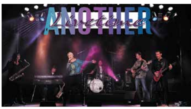
ANOTHER LIVETIME - DIE HÜTTENWERK-HAUSBAND 16.30 UHR

FISTFUL OF CHILI - das sind vier Odenwälder Musiker, die es sich zur Aufgabe gemacht haben, Songs von „Red Hot Chili Peppers“ und „Rage against the machine“ unter's Volk zu bringen.