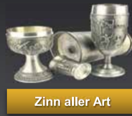
Zinn aller Art