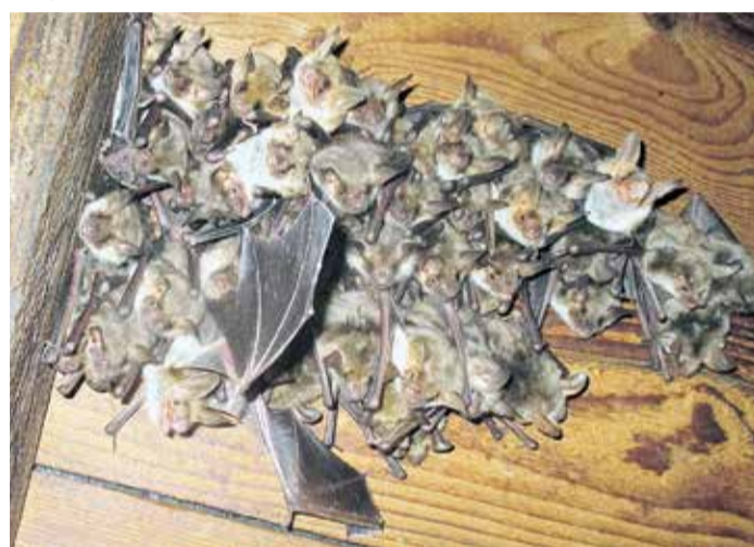
Eng zusammengeschult sind die Großen Mausohren im Bahnhof.

ab circa 22 Uhr miterleben können, wird der Bahnhof bis circa 23 Uhr geöffnet sein. Der Eintritt ist frei.