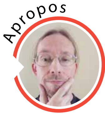
von Sven Iwertowski, Redaktionsleiter