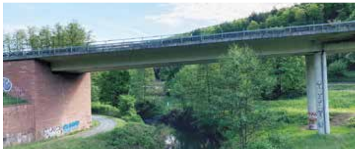
Abbruch der Zeller Brücke wird vorbereitet Seite 14

Tradition trifft Vielfalt: In Bad König steht der Pfingstmarkt in den Startlöchern Seite 8-9