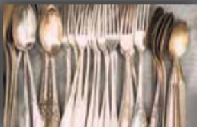
Silberbestecke & Versilbert