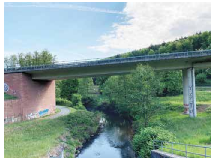
Die Sperrung der Zeller Brücke hat weitreichende Folgen auch für die Wirtschaft. Nun wurde mit Vorabmaßnahmen begonnen.

Auch bei der aktuellen Verkehrssituation sollen Optimierungen folgen, etwa bei der Beschilderung und bei der Radwegumleitung.