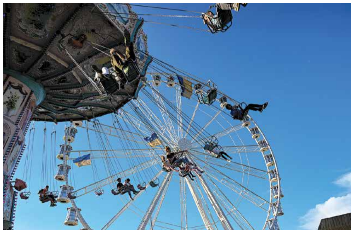
Ein bisschen wie ein Vogel kann man sich auf dem Kettenkarussell des Bienenmarktes fühlen. Auch mit dem Riesenrad „Colossus“ geht es hoch hinaus.

Am nächsten Freitag startet der Bienenmarkt in Michelstadt