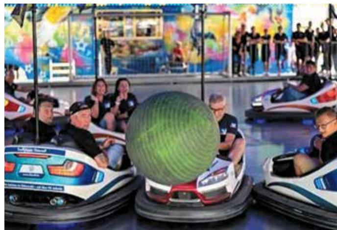
Im Kleinwagen auf der Jagd nach dem großen grünen Ball.

Zweit- und Drittplatzierten gibt es jeweils einen Pokal sowie 80 Euro (2. Platz) und 50 Euro (3. Platz) in Wiesemaikpennich. Alle weiteren Teilnehmer erhalten eine Medaille. Anmeldung über das Anmeldeformular (Download unter www.erbach.de/wiesenmarkt/ ) oder per E-Mail an marktmeister@erbach.de .