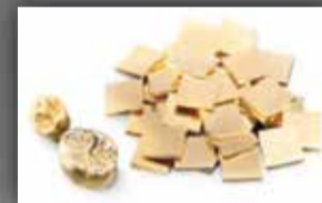
Dentalplättchen & Gold Staub