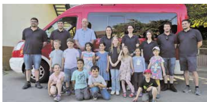
Die Kinder absolvierten „Tatze 1“ oder „Tatze 2“.

Michelstadt-Steinbach. Die jüngsten Mitgliedern der Kinderfeuerwehr hatten vor Kurzem die Gelegenheit, das „Tatze“-Abzeichen zu erlangen. Acht für das Abzeichen „Tatze 1“, vier für „Tatze 2“. Die Prüfungen sind altersgerecht gestaffelt: Bei „Tatze 1“ müssen die Kinder etwa einen Feuerwehrynoden binden, den Notruf erklären und mit Streichhölzern sicher umgehen. „Tatze 2“ baut darauf auf – mit weiteren Knoten, Aufgaben der Feuerwehr und dem sicheren Anzünden einer Kerze. Alle Teilnehmer bestanden erfolgreich und erhielten Abzeichen, Urkunden und kleine Geschenke. red