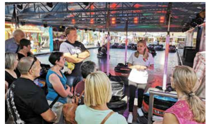
Die Teilnehmer der Backstage-Tour erhalten einen spannenden Einblick hinter die Kulissen von Südhessens größtem Volksfest.