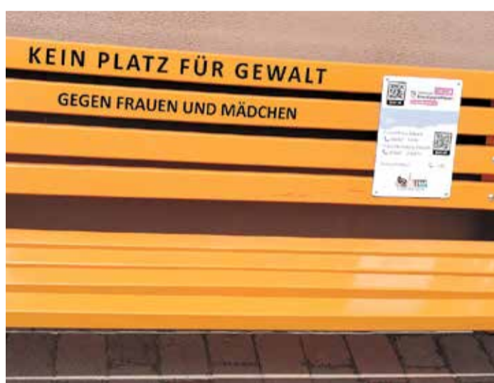
Bank vor dem Rathaus in Beerfelden.

Oberzent. Jeweils eine orangefarbene Bank steht gut sichtbar in Beerfelden, Rothenberg, Hesseneck und Sensbachtal. Die Aufschrift auf den Bänken lautet: „Kein Platz für Gewalt gegen Frauen und Mädchen“. Außerdem ist eine Hinweistafel mit Hilfefonnummern (Frauenhaus Erbach, Frauenhausberatung Erbach, Polizei Notruf und Gewalt gegen Frauen) angebracht. Das Aufstellen der Bänke wurde von der Stadtverordnetenversammlung Oberzent auf Initiative der Grünen-Fraktion umgesetzt. red