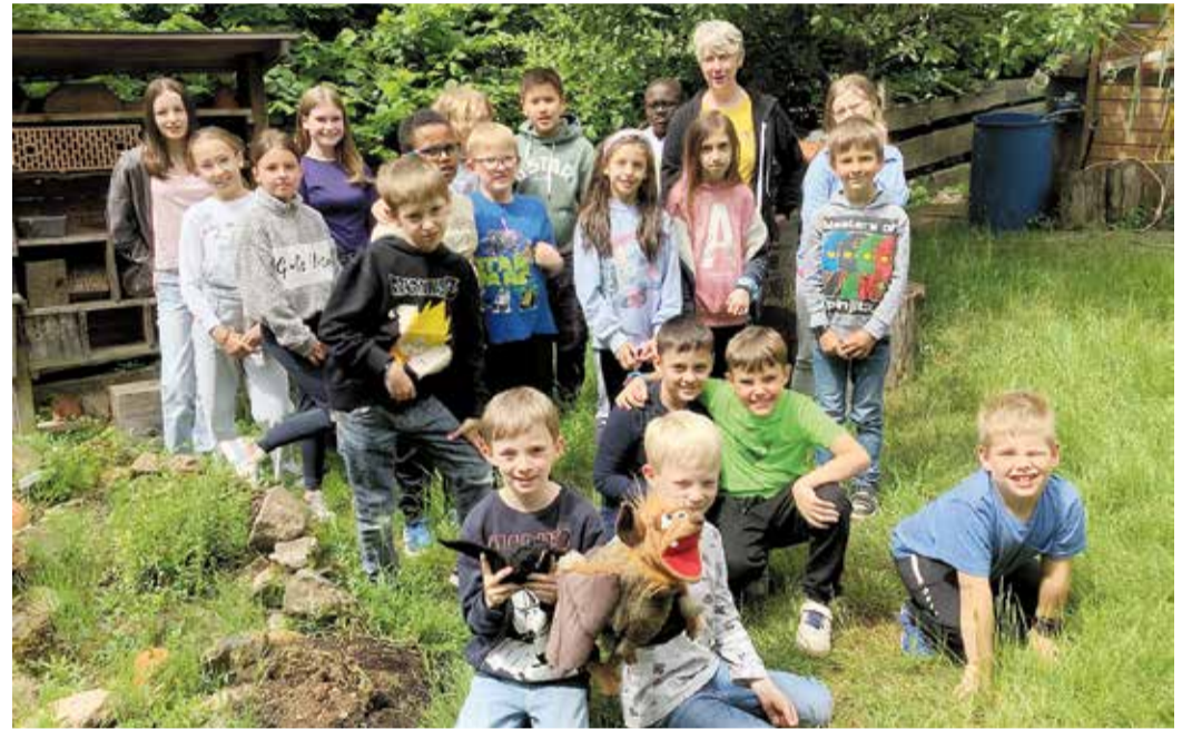
Wissbegierig und engagiert – Schüler der Reichenbergschule arbeiteten mit Schülern aus Dreieich zusammen.