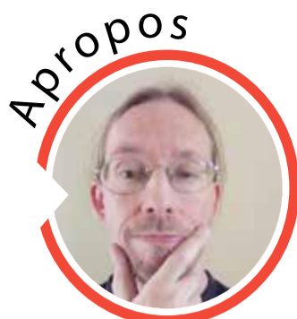
von Sven Iwertowski, Redaktionsleiter