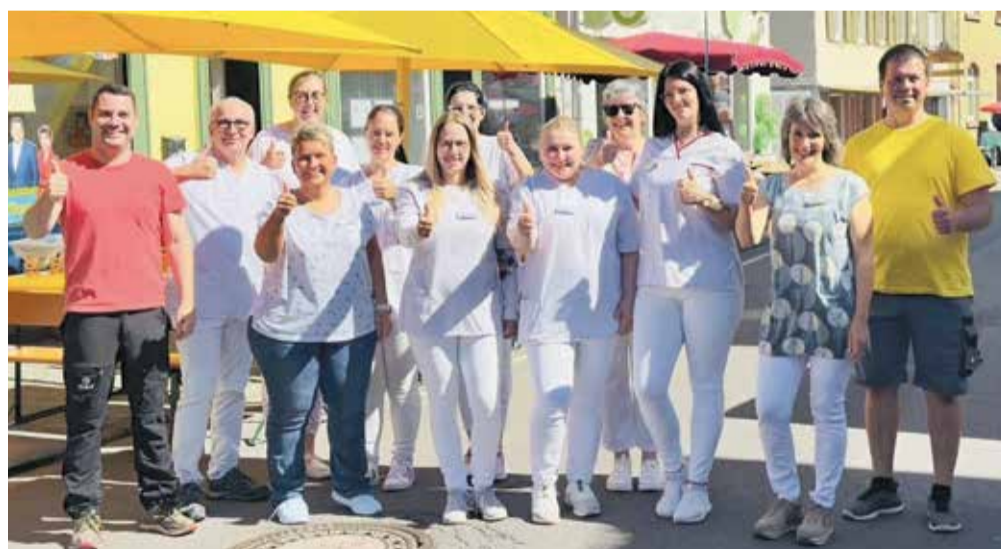
Die Mitarbeiterinnen und Mitarbeiter der Mobilen Pflege Bad König/Brombachtal und der Frühberatungsstelle im Odenwaldkreis freuen sich, wie hier im vergangenen Jahr auf dem Gruppenbild, auf dem Pfingstmarkt in Bad König mit dabei gewesen zu sein. Am kommenden Montag, dem 9. Juni 2025 ist das Team wieder ansprechbar auf einem liebevoll vorbereiteten Stand in der Bahnhofstraße 47.

Vorstellung von Angeboten in der Bahnhofstraße 47