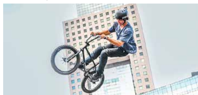
Fahrradfreunde können auf dem Eurobike Festival in Frankfurt am 28. und 29. Juni über 1.500 Marken, spannende Shows, Teststrecken, Trends und Mitmachaktionen erleben. Highlights sind Weltstars, Radrennen, Stunts, neue Innovationen und die Möglichkeit, Fahrräder und Zubehör direkt vor Ort zu kaufen.

frankfurt/de/eurobike-festival/eurobike-festival.html