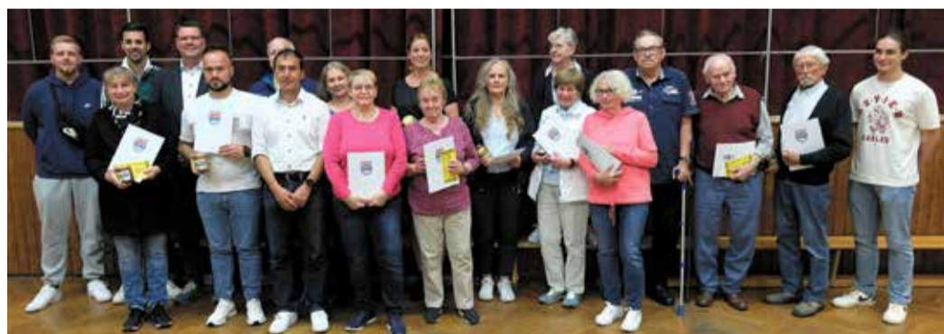
Ehrungen für Engagement und Sport.