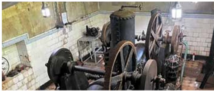
Zum Mühlentag öffnen auch Pumpwerke die Tore Seite 2

Familientag und Feuerwerk: Volles Programm auf dem Bienenmarkt Seite 6