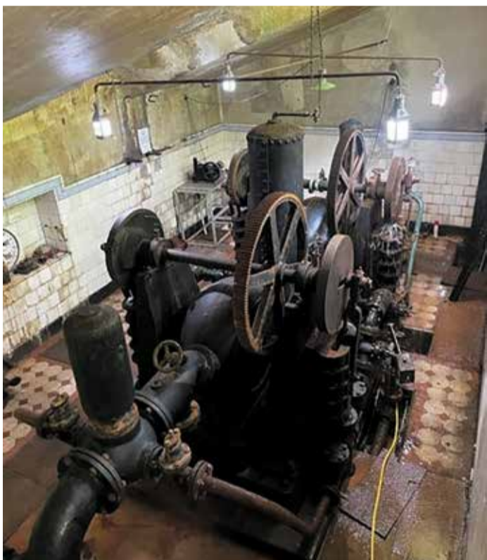
Peltonrad-Pumpwerk im Innern des historischen Wasserwerkes Vielbrunn.

Zum Mühlentag sind historische Wasserwerke zu sehen