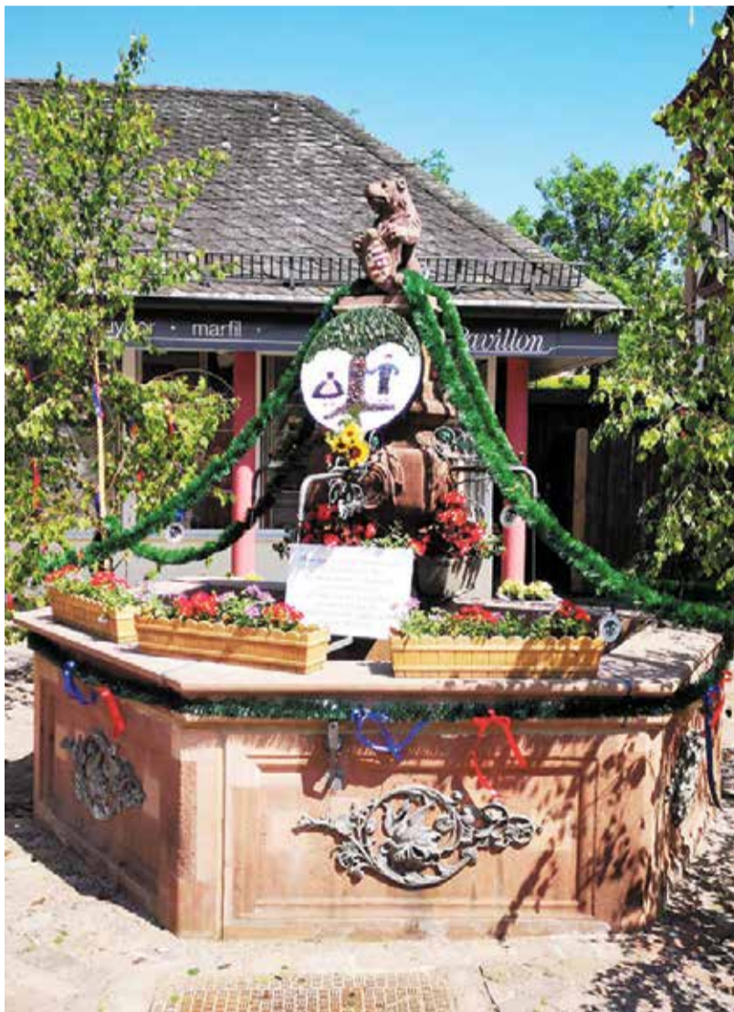
So festlich soll es zu Pfingsten an mehreren Orten in Erbach aussehen – Zeichen einer lebendigen Tradition.

Pünktlich zum Pfingstwochenende verwandeln sich die Brunnen der Erbacher Altstadt in kunstvoll geschmückte Schmuckstücke. Verantwortlich für den festlichen Pfingstschmuck sind ortsansässige Vereine, die sich ehrenamtlich als Brunnenpaten engagieren. In diesem Jahr werden die Brunnen am 6. Juni mit frischem Birkenlaub, farnefrohen Bändern und einem individuellen Brunnenspruch verziert. Am darauffolgenden Tag, 7. Juni, findet um 10.30 Uhr ein öffentlicher Stadtrundgang statt, bei