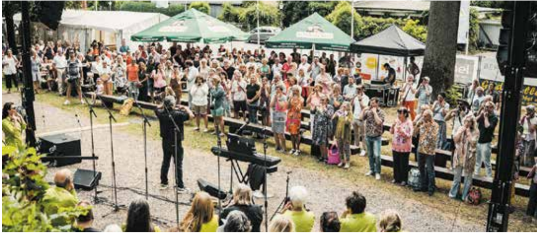
500 internationale Stimmen sind auf dem Festival zu hören.