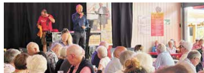
Ein fester Bestandteil des Erbacher Wiesenmarkts: Der Seniorenfrühschoppen.

Erbach. Am Dienstag, 22. Juli, ist es ab 11 Uhr für die „älteren Semester“ so weit: Dann startet der Seniorenfrühschoppen für die Bürger Erbachs ab 70 Jahren mit viel Musik, guter Stimmung und Gesprächen. Gefei-ert wird in den Bierhallen 3 und 4, wo das „Nibelungen Duo“ mit Musik für Unterhaltung sorgt. Als Dankeschön für ihre langjährige Verbundenheit zur Stadt erhalten die Senioren Gutscheine für Speisen und Getränke. Im Anschluss gibt es per Gutschein eine kostenlose Fahrt auf dem Riesenrad. red