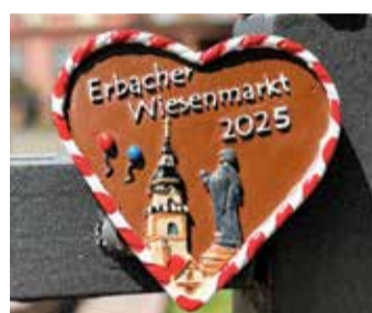
Das Wiesenmarktherz 2025.

und das Denkmal des Grafen. Seit 150 Jahren begleitet die Figur als Wahrzeichen das größte Volksfest des Odenwalds und Südhessens. Erhältlich ist das neue Ansteckerherz ab dem 1. Juli für zwei Euro in der Touristik-Information mit Odenwald-Laden im Alten Rathaus. Während des Wiesenmarkts kann es im Marktbüro erworben werden. red