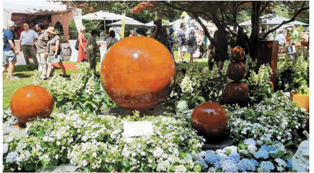
Bunte Dekorationen für den Garten.

quollen aus allen Nähten. Wer es auf das Gelände der Country Fair geschafft hatte, wurde reich belohnt: Blumen und Gewächse in tausend Formen und Farben, praktisches Gerät und ansprechende Dekorationsmaterialien gab es reichlich und machte die Wartezeiten vergessen. red