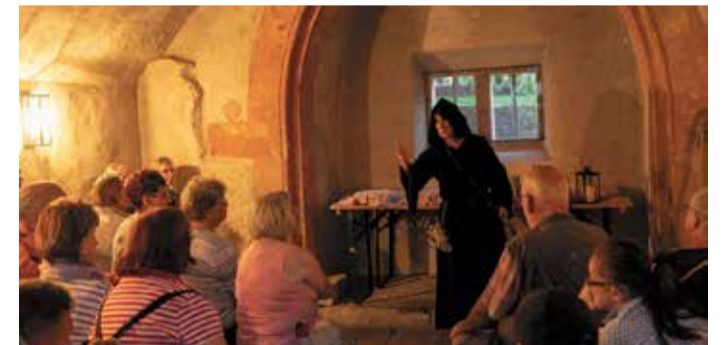
Eine Reise in die mittelalterliche Welt.

dung unter: touristik@michelstadt.de oder Tel.: 06061 74610. red