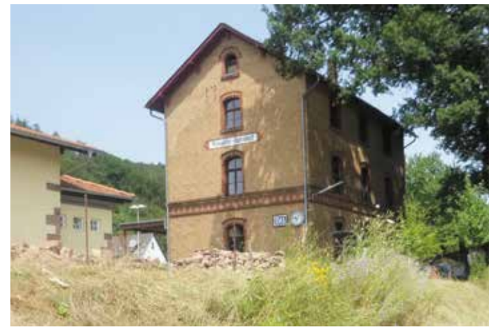
Im ehemaligen Bahngelände findet sich die Wochenstube des Großen Mausohrs.

wickelt. Etwa 1.600 Tiere ziehen ihren Nachwuchs heran. Dieser Aktionstag wird voraussichtlich der letzte Öffnungstag des Jahres sein, an dem sich der Blick auf den Dachboden per Kamera lohnt. Die Tiere verlassen ihre „Wochenstube“ in den nächsten Wochen, im September sind nur noch wenige Tiere zu sehen: „Die meiste Zeit schlafen sie dann“, so Diplom-Biologe Dirk Diehl, Ansprechpartner des Mausohrbahnhofs.