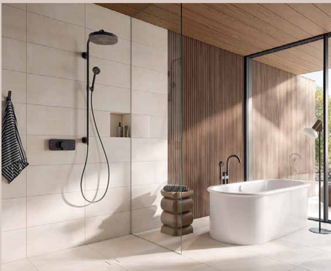
Mit durchdachten Fliesenlösungen lässt sich das Bad zur Wohlfühloase umgestalten.

Das ehemalige Motto „große Räume, große Fliese, kleine Räume,