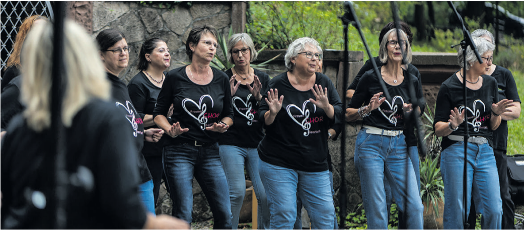
Ausgelassene Stimmung auf dem Chorfestival.

CHÖRE ERHEBEN BEI GUTEM WETTER DIE STIMMEN