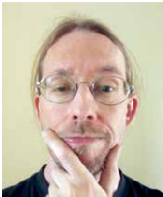
von Sven Iwertowski, Redaktionsleiter

Die Odenwälder Landwirte haben schon einiges mitmachen müssen. Die Mittelgebirgsregion des Kreises hält für die Feldarbeit einige Herausforderungen bereit. Nun kommt noch