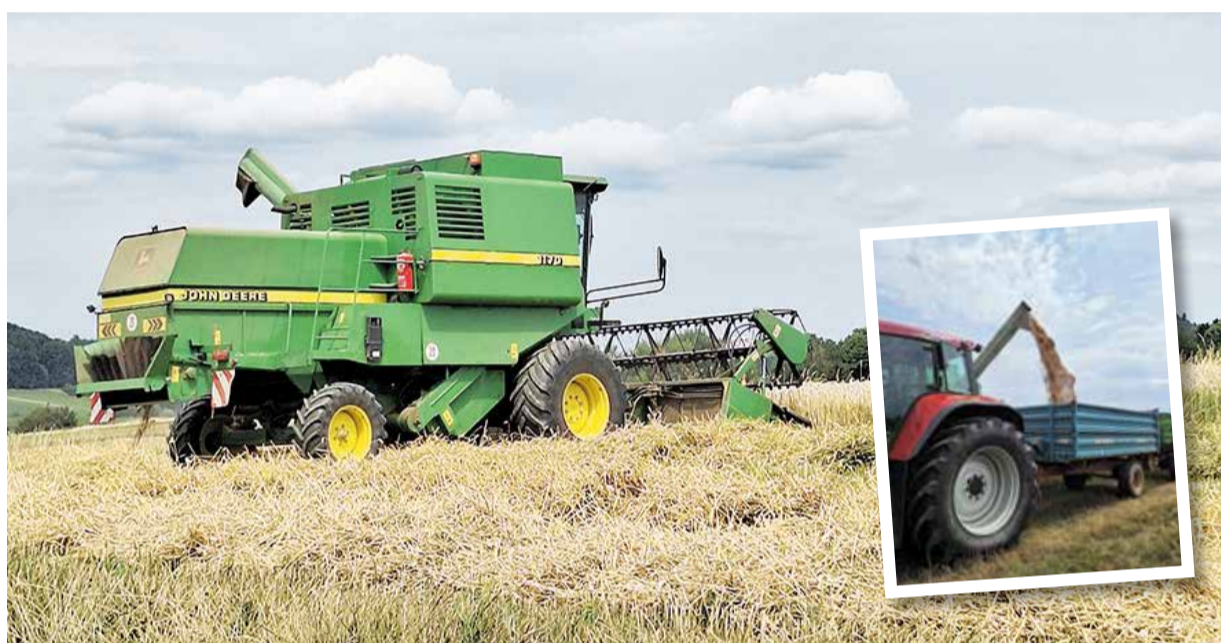
Die Sommerernte ist im Odenwaldkreis eher mau – das Wetter spielte nicht so mit. Aber es gab auch Überraschungen.

DAS WETTER MACHT VIELEN BAUERN ZU SCHAFFEN