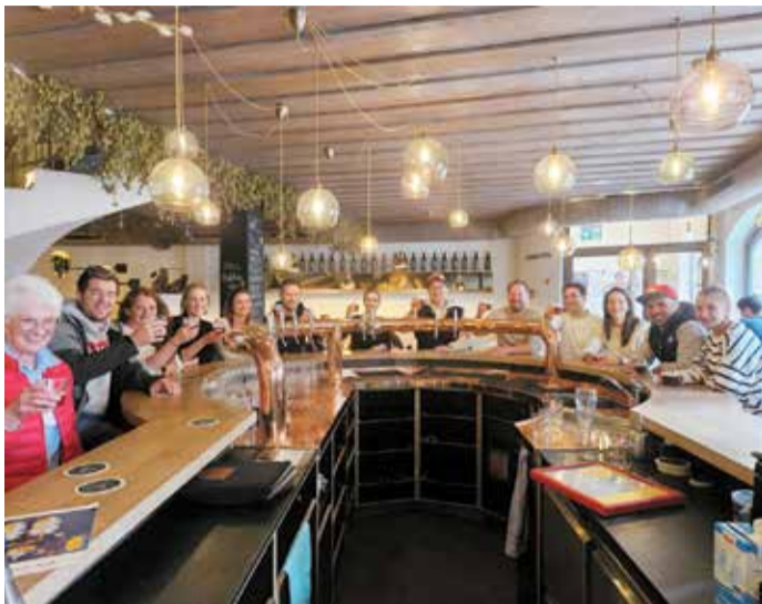
Geschichtsinteressierte beim Verkosten von Bier.

FACHKUNDIGE FÜHRUNG VERBINDET ALTSTADT-CHARME MIT BRAUKUNST UND VERKOSTUNG