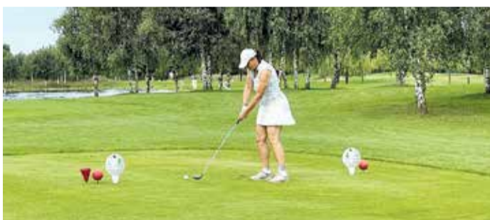
Abschlag zu einer runden Summe – 15.000 Euro für krebserkrankte Kinder kamen bei der WCGTour zusammen.

GOLFER ERSPIELEN 15.000 EURO FÜR KREBSKRANKE KINDER