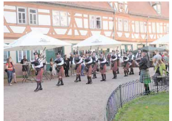
Schottisches Lebensgefühl und Dudelsackmusik gibt es im August in Erbach zu erleben.

Erbach. Dudelsäcke, Whisky und ein Abend mit schottischer Kultur: Das gibt es am heutigen Samstag, 23. August, im Erbacher Schlosshof ab 18.45 Uhr. Einlass ist um 17.30 Uhr. Eines der musikalischen Highlights sind zum Beispiel die Clanpipers Frankfurt, die als älteste Pipeband Deutschlands auf etliche musikalische Erfolge zurückblicken können. Eine tänzerische Einlage präsentiert die Tanzgruppe „Uniceltics“ mit Steppschritten und Formationstänzen. Orchestralen Rock und Folk-Klassiker verbindet die Band Lagana bei ihrem Auftritt. Auch die Doune-Pipe-Band und das Glenbervie-Folk-Duo bereichern das Programm. Abseits des Bühnenprogramms gibt es für die Besucher noch mehr schottische Kultur zu erleben. Neben einem ausgewählten Angebot an Speisen darf auch das breite Sortiment an schottischen Whiskys nicht fehlen. An der Whiskybar und der Whiskylounge können Geschmacksrichtungen von leicht-fruchtig bis rauchig-intensiv genossen werden.