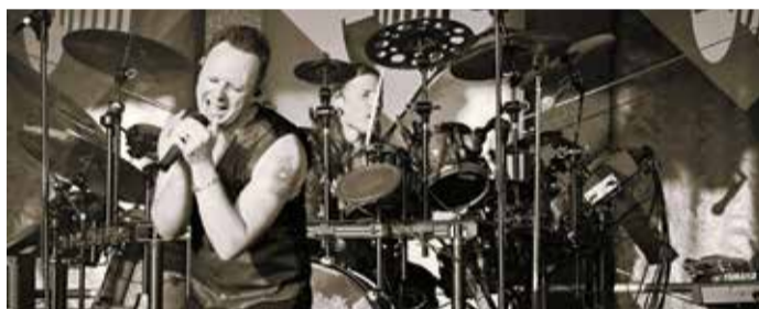
Mit Leidenschaft und Gefühl: Depeche Reload auf der Bühne.