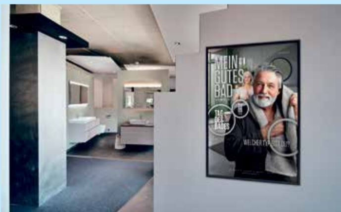
Badetage gibt es (hoffentlich) öfter. Aber den Tag des Bades eben nur einmal im Jahr: in diesem Jahr am 20. September.

Mehr Informationen finden Sie unter www.gutesbad.de .