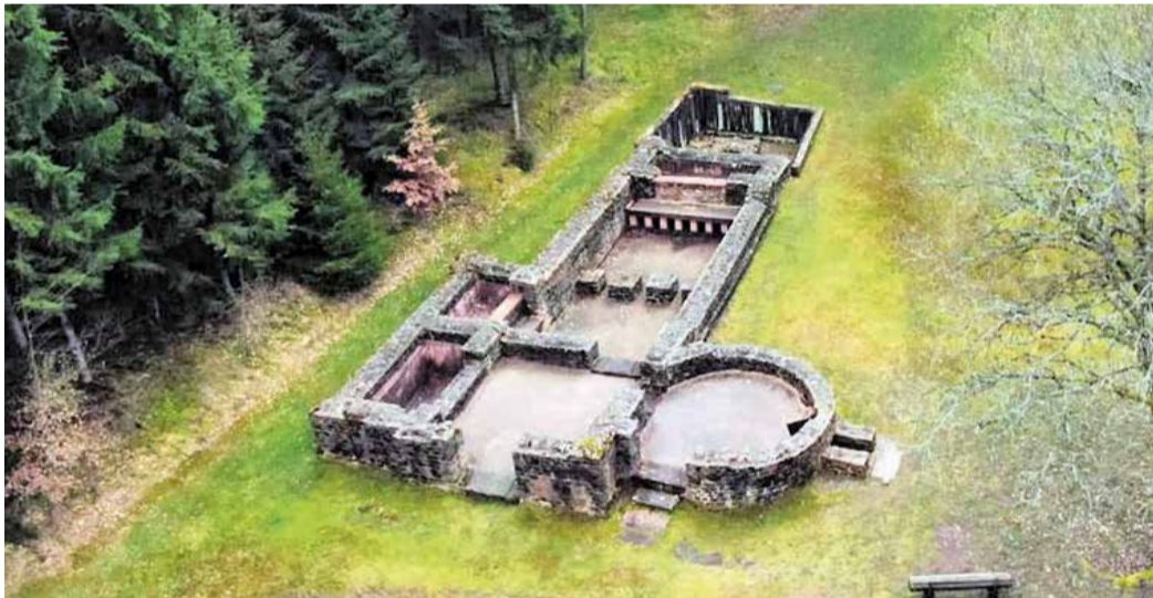
Das Römische Dampfbad in Würzburg.