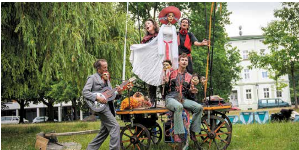
Die „Rote Zora“ kommt am 25. September nach Michelstadt.

OPEN-AIR-AUFFÜHRUNG VERSPRICHT EIN SPEKTAKEL FÜR FAMILIEN