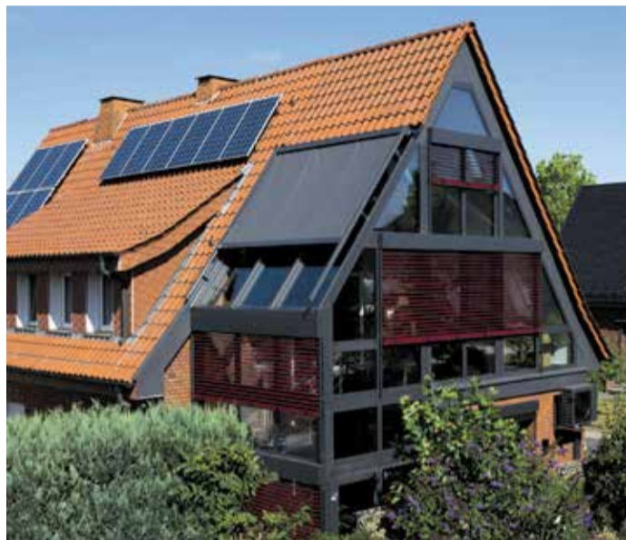
Die großzügige Glasfront des Wintergartens eröffnet einen weiten Blick in die Natur, als ob sich Haus und Garten vereinen

Eine Gaube ist ein Dachaufbau auf das bestehende Schrägdach, durch den zusätzliche Wohnfläche mit voller Stehhöhe gewonnen wird. Sie kann in unterschiedlichen Formen realisiert werden und verändert das Gesamterscheinungsbild eines Hauses maßgeblich. Das kann sich einerseits als interessanter architektonischer Akzent erweisen, andererseits auch problematisch sein. Denn bei nahezu allen Bauvorhaben dieser Art ist eine Baugenehmigung erforderlich. Zudem ist bei denkmalgeschützten Gebäuden solch eine Veränderung