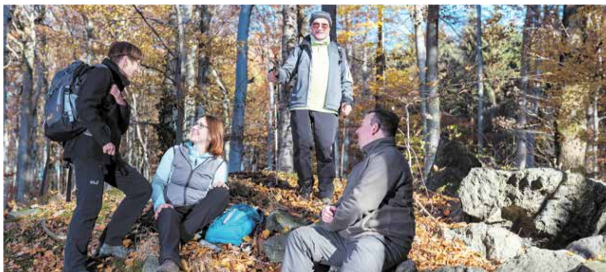
Eine kleine Rast in spätsommerlichen Odenwald - hier nahe Reichelsheim - erfrischt Körper und Geist.

WIE TAGESWANDERUNGEN JETZT KÖRPER UND SEELE BELEBEN