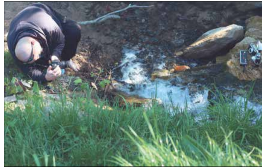
Das Projekt bietet Teilnehmenden die Möglichkeit, digitale Kompetenzen aktiv und praxisnah zu entwickeln.

Digitale Kompetenzen stärken, Perspektiven schaffen – praxisnah und individuell begleitet