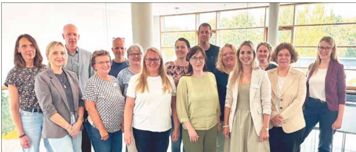
Vertreterinnen und Vertreter des Gesundheitszentrums Odenwaldkreises (GZO) und der Bundesagentur für Arbeit beim gemeinsamen Austausch in Erbach: Im Mittelpunkt standen Strategien zur Fachkräftesicherung und die Stärkung der Ausbildungsangebote im Gesundheitswesen.

Gesundheitszentrum Odenwaldkreis und Bundesagentur für Arbeit vertiefen Zusammenarbeit