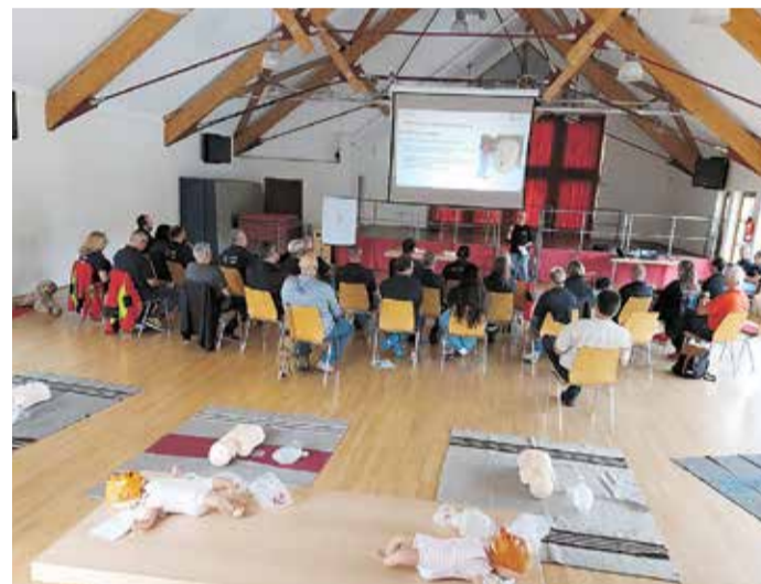
Um Kindernotfälle ging es kürzlich bei einer Fortbildung für Voraushelfer aus dem Odenwaldkreis im Dorfgemeinschaftshaus in Michelstadt-Würzburg.

Unter der Leitung erfahrener Notfallsanitäter des DRK Kreisverbands wurden in vier Stunden sowohl die Theorie zu verschiedenen Krankheitsbildern und kritischen Verletzungen vermittelt als auch