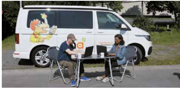
Ehemalige Teilnehmer der InA gGmbH bei der Recherchearbeit von offenen Stellen am „InA-Van“.

Erbach. Die Maßnahme „Perspektive“ der InA gGmbH in Kooperation mit dem Kommunalen Job-Center begleitet seit September 2024 Menschen mit Vermittlungshemmnissen zurück in Alltag, Struktur und Beschäftigung. Kurz vor Ende der dritten Runde ziehen die Verantwortlichen eine positive Bilanz: Drei Teilnehmer fanden erfolgreich den Weg in den Arbeitsmarkt, viele weite-