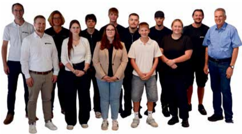
Treffpunkt Thierolf begrüßt die neuen Auszubildenden