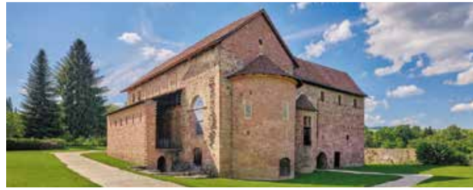
Die Einhardsbasilika in Michelstadt-Steinbach, Foto: Michael Leukel

Michelstadt. Die Staatlichen Schlösser und Gärten Hessen laden am Samstag, 4. Oktober, um 11 Uhr zu einer öffentlichen Führung in die Einhardsbasilika in Steinbach ein. Das um 820 von Einhard, dem Berater Karls des Großen, errichtete Gotteshaus gilt als eines der besterhaltenen karolingischen Bauwerke