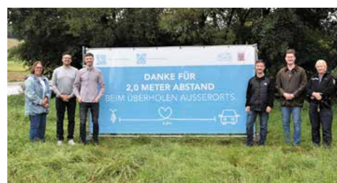
red Mit ausreichend Abstand sicher unterwegs.

Ein einfacher Trick hilft bei der Einschätzung: Die Länge eines Erwachsenenfahrrads (ca. 1,50 m) dient als guter Richtwert für den innerörtlichen Abstand. Streckt man beide Arme seitlich aus, entspricht diese Spannweite in etwa der eigenen Körpergröße und veranschaulicht so die notwendigen Sicherheitsabstände.