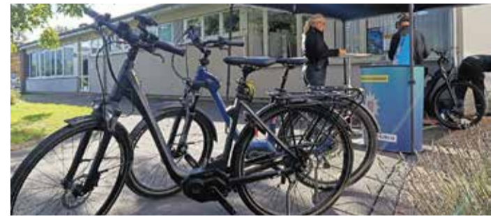
Präventionsarbeit: Im Rahmen der Europäischen Mobilitätswoche wurde vor dem Landratsamt in Erbach die Fahrradcodierung angeboten.

sowie individuellen Buchstaben und Zahlen besteht, können rechtmäßige Eigentümer nach einem Diebstahl leichter ermittelt werden. Die Codierung soll abschrecken und erleichtert zudem die Rückgabe gestohlener Räder. Eine weitere Gelegenheit zur Registrierung ist für das Frühjahr geplant; Interessenten können sich per E-Mail an fussundrad@odenwaldkreis.de vormerken lassen. red