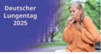
Dieser Beitrag wurde von Insmed unterstützt.

In vielen Fällen bleibt die Ursache jedoch unbekannt. Es gibt in Deutschland wahrscheinlich mehr als 100.000 Betroffene – Tendenz steigend. Die Lebensqualität wird erheblich beeinträchtigt. Oft wird die Erkrankung als Asthma oder COPD fehlagnostiziert. Eine korrekte und frühzeitige Diagnose sowie Behandlung sind wichtig, um die Folgen zu minimieren. Mehr Informationen finden Sie unter www.atemwegsliga.de