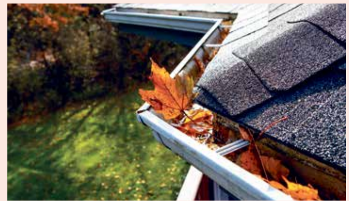
Eine Reinigung der Dachrinne gehört auch zum DachCheck.

(akz-o) Das Dach ist die wichtigste Schutzschicht des Hauses – es hält Regen, Schnee, Hagel und Hitze ab und sorgt dafür, dass das Zuhause ein sicherer Lebensraum bleibt. Doch die Belastungen für Dächer nehmen zu: Rekordhitze im Sommer, Starkregen, Stürme und Schneefall im Winter setzen der Gebäudeschutzschicht immer stärker zu. „Schon kleine Schäden am Dach können große Folgen haben – zum Beispiel, wenn sich Ziegel lockern, Risse entstehen oder Regenwasser eindringt. Oft bleiben solche Mängel lange unbemerkt und führen dann zu erheblichen Schäden an der Bausubstanz“, warnt Dachdeckermeister Jan Redecker, technischer Geschäftsführer beim Zentralverband des Deutschen Dachdeckerhandwerks (ZVDH). Besonders wichtig: Auch Versicherungen verlangen von Hausbesitzern und -verwaltern eine regelmäßige fachkundige Dachwartung. Wer diese vernachlässigt, riskiert im Ernstfall seinen Versicherungsschutz. Das kann im Schadenfall nicht nur teuer werden, sondern sogar existenzbedrohend sein – etwa, wenn durch herabfallende Dachteile Dinge beschädigt oder Personen verletzt werden. ZVDH-Jurist Elmar Esser erläutert: „Bei starkem Wind kam es zu einem Schadenfall, bei dem ein Auto durch