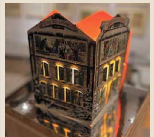
Carl Gottlob Schönherr: Adventshäuschen (Nr. 7019), Verlag der St.-Johannis-Druckerei, Dinglingen (Baden), 1927