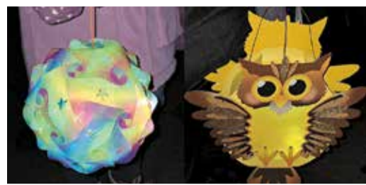
Brensbach Lichterfest im Wald Seite 2

Telefon 06165/93090 - info@odw-journal.de - www.odw-journal.de