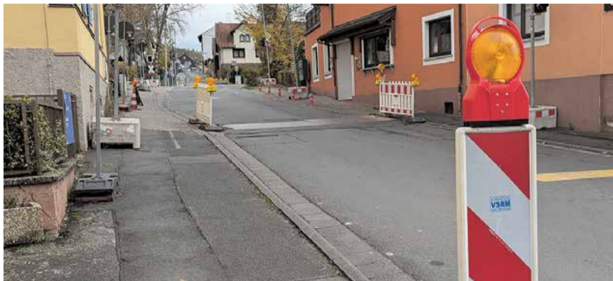
Wie lange die Durchfahrt in Bad König-Zell gesperrt sein wird, ist noch ungewiss.

DIE VOLLSPERRUNG DER ORTSDURCHFART LEGT DEN VERKEHR LAHM UND BRINGT ANWOHNER WIE BETRIEBE AN IHRE GRENZEN