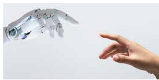
Erbach Vortrag über KI Seite 5