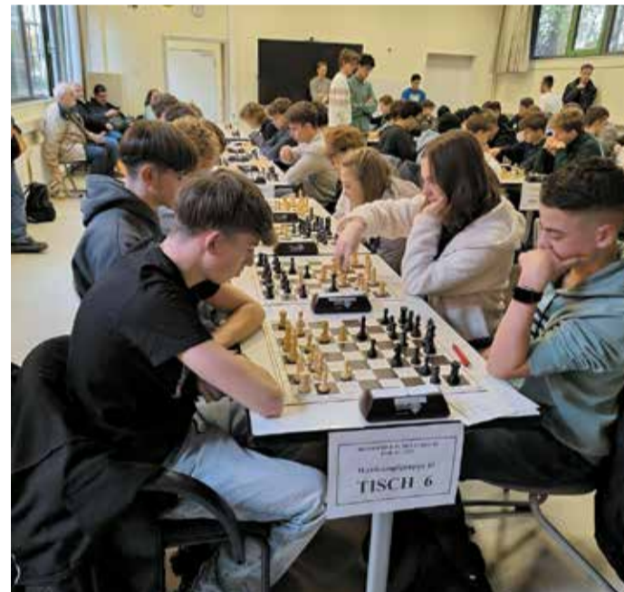
Hochkonzentrierte Schüler beim Schach.

Vordergrund und machten den verpassten Top-Five-Platzes zu Wettbewerb trotz des knapp einem vollen Erfolg. red