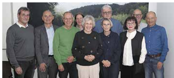
Neugewählte und ausgeschiedene Mitglieder des Vorstandes.

Erbach/Michelstadt. Die HOSPIZ-Initiative-Odenwald blickt auf ein aktives Jahr zurück: 2025 führten die Ehrenamtlichen 51 Sterbegleitungen durch und betreuten regelmäßige Trauergruppen für Erwachsene und Kinder. Das Rotary-Hospiz in Erbach ist derzeit durchschnittlich zu 90 Prozent ausgelastet. Im vergangenen Jahr konnte der dringend benötigte Erweiterungsbau am Rotary-Hospiz in Betrieb genommen werden, der vom Ehrenpräsidenten des Rotary-Clubs Erbach-Michelstadt vollständig finanziert wurde. In den neuen Räumlich-