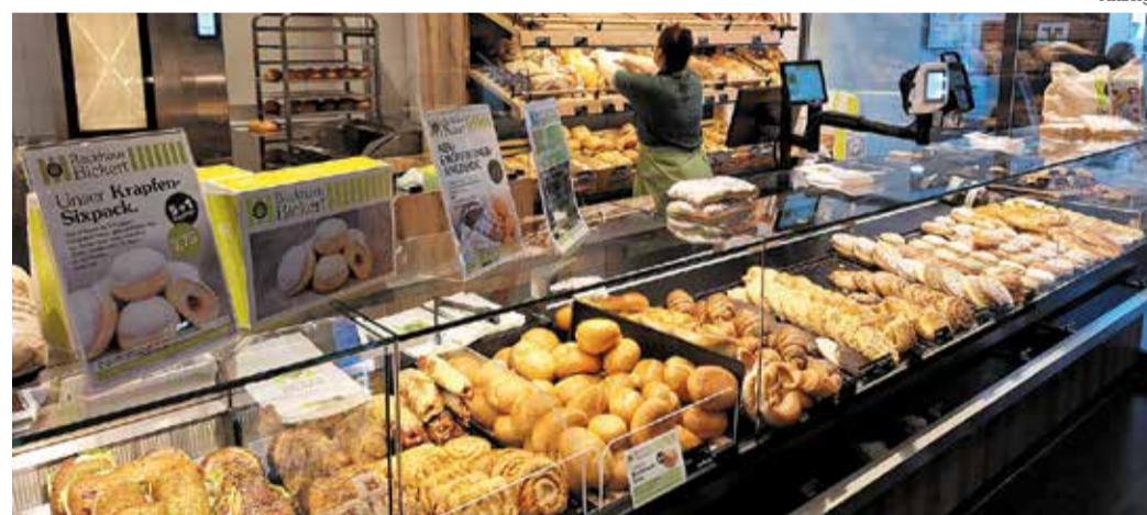
Große Auswahl und Frische in der neuen Bickert-Filiale im Volksbank-Atrium in Bad König.