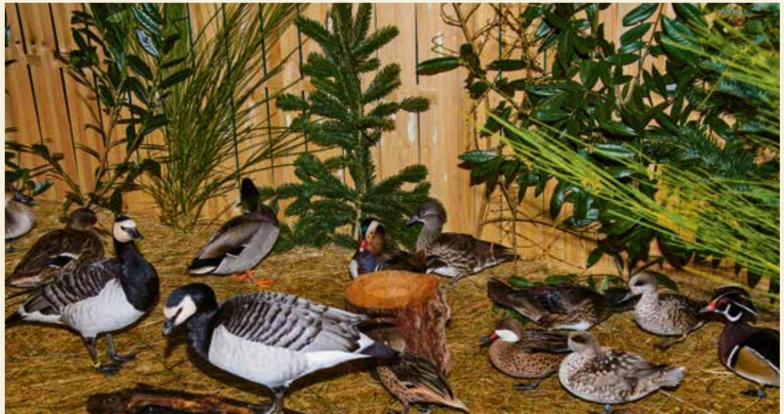
Bei der Lokalschau des Reichelsheimer Rasse- und Ziergeflügelzuchtvereins machte gleich am Eingang zum großen Ausstellungsraum das Wasserziergeflügel um das Wasserbecken auf sich aufmerksam.

Für ihre Zuchterfolge bei den Enten erhielten Silke Höhner, vertreten durch Sohn Lukas, eine Ehrenplak- ette im Rahmen der Lokalschau