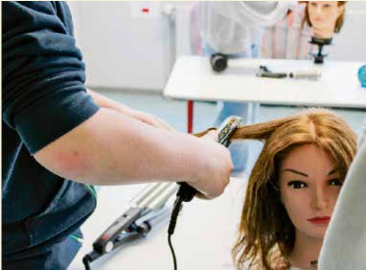
Der Workshop „Friseur“ bei der „Olympiade der Berufe“ an der GAZ.