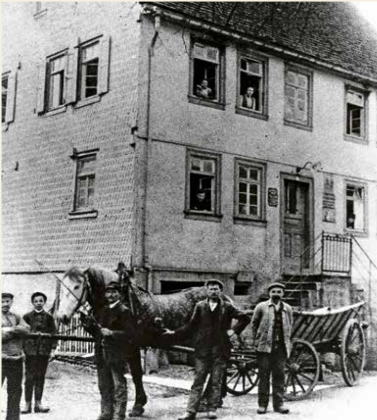
Blick auf das Anwesen „Mehl-Schwob“ in der Darmstädter Straße 5 im Jahr 1913.

voneinander entfernt wiederum zwei Geschäfte für Haushaltswa-ren. Zwischen beiden folgte auf eine der zahlreichen Metzgereien ein Radiogeschäft, in das später ein Gemüseladen Einzug hielt und heute eine Versicherung ihr Domi-zil gefunden hat.