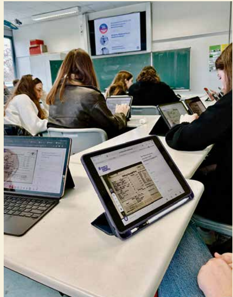
Die Oberstufenkurse der Jahrgangsstufe Q1 bei der Arbeit mit der Website.