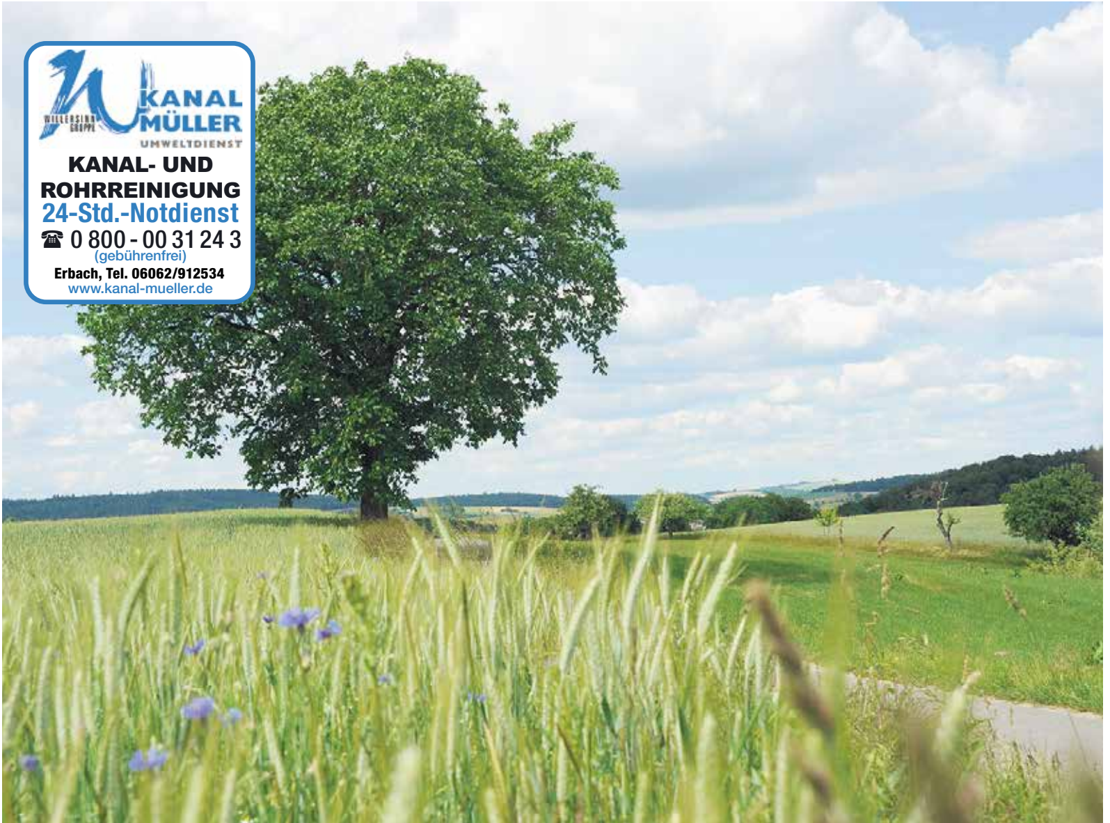
Auf dem Höhenweg von Reichelsheim nach Fränkisch-Crumbach.