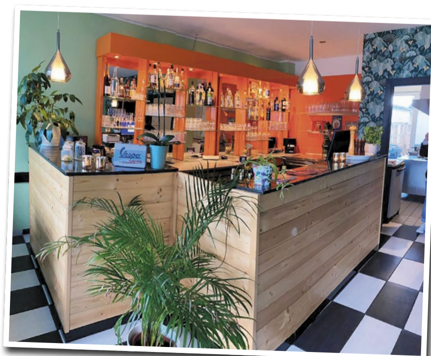
Das warme Ambiente des Restaurants

steht der Brunnen aus rotem Sandstein als Trinkbrunnen im Viertel. Der Brunnen mit dem großen Steinfrosch ist ein Wahrzeichen der Region, und die Liebe zu Fröschen kommt nicht von ungefähr. Der Name „Froschbrunnen“ geht auf den ehemaligen Löschteich zurück, der an den Geräteraum der Freiwilligen Feuerwehr angrenzte. Besonders kleine Amphibien fühlten sich in diesem Löschteich wohl und trieben die Anwohnerinnen und Anwohner, durch nächtelanges Quaken, regelmäßig in den Wahnsinn. Da das Froschkonzert nicht enden wollte, musste der Teich allerdings verschwinden.