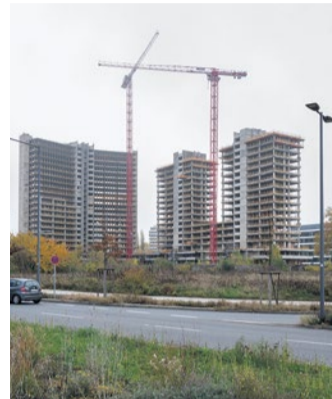
Das Gerippe der ehemaligen KWU-Türme am Kaiserlei

summe haben die beiden Unternehmen Stillschweigen vereinbart. Die ABG bereitet nun für das Frühjahr 2026 den Abbruch der Gerippe der ehemaligen KWU-Türme vor. Bezugsfertig wird das Projekt voraussichtlich ab dem Jahr 2029 sein.