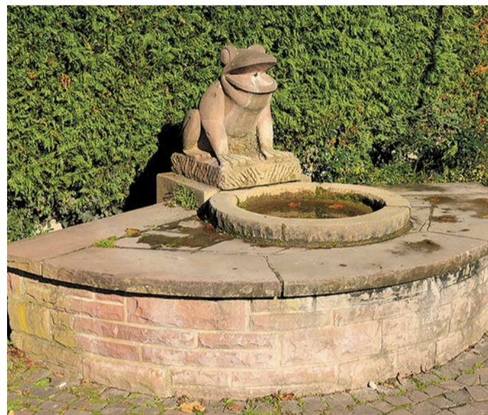
Der Froschbrunnen (©Kunst im öffentlichen Raum)

im klassischen Sinne, sondern ein Stück Grün für den täglichen Gebrauch. Der Park zeigt, dass es in Zeilsheim nicht auf Größe ankommt, sondern auf Nähe und Verfügbarkeit. Wer einen Ort für eine kleine Pause sucht, findet