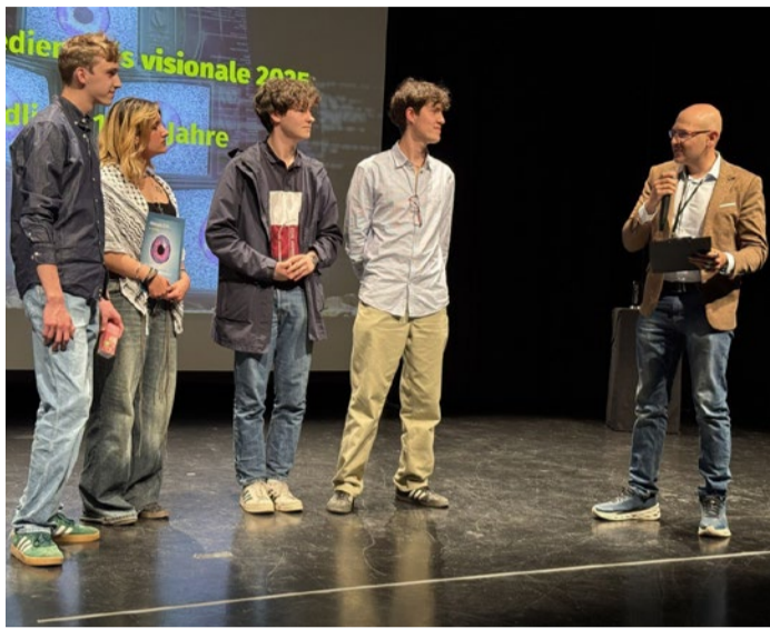
Visionale 2025 Preisverleihung

Digitale Medienprojekte können bis zum 6. Februar 2026 eingereicht werden