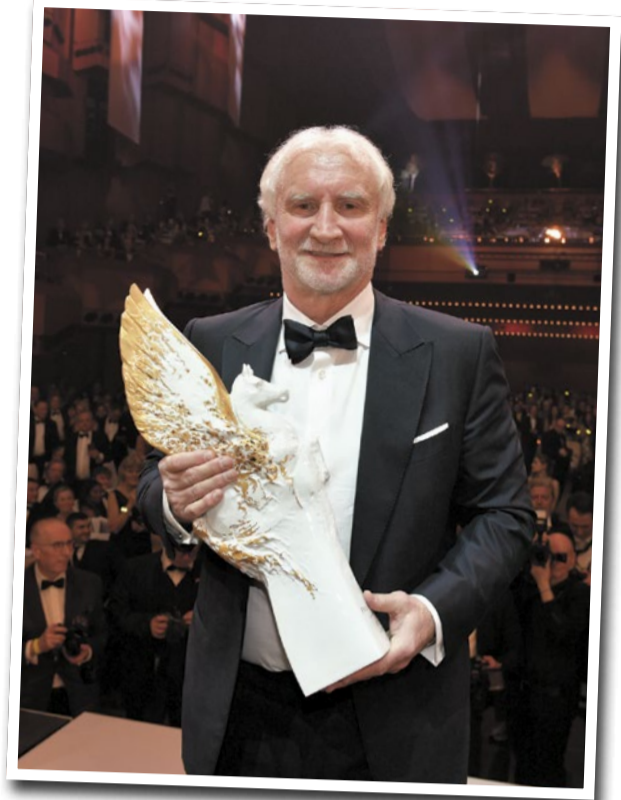
Rudi Völler mit erhaltenem Preis.