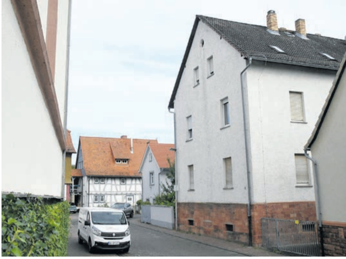
Was wird aus dem gemeindeeigenen Objekt in der Eppertshäuser Schulstraße 5? Diese Frage darf sich die Kommune auch deshalb stellen, weil die Asylbewerber-Zahlen im Ort deutlich zurückgegangen sind.

Ende 2023 betreuten Garbella und Groh noch 93 Personen, die innerhalb Eppertshausens in Gemeinschaftsunterkünften des Landkreises sowie in Privatwohnungen untergebracht