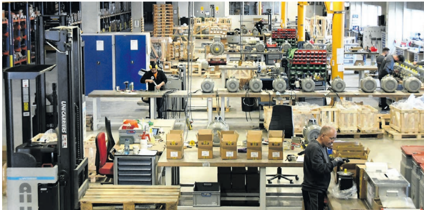
Blick hinter die Hallenwände von AC-Motoren, einem der größten Arbeitgeber und Gewerbesteuer-Zahler Eppertshausens. Eine andere Firma hat den „Park45“ im Frühjahr hingegen verlassen. Freude machen der Gemeinde Gewerbesteuer-Nachzahlen örtlicher Betriebe für die Jahre 2023 und 2024. Finanzielle Sorgen bereitet der finanzielle Blick nach vorn.

„Die Gewerbesteuereinnahmen im Haushaltsjahr 2025 gestalten sich eigentlich sehr positiv“, sagte Brockmann. Die Gemeinde rechne mit Mehreinnahmen von „zunächst 2,1 Millionen Euro“ aus Nachzahlungen, die Firmen für die vergangenen beiden Jahre leisten müssten. Darüber hat das Finanzamt Dieburg die Kommune unterrichtet. Brockmanns Wortwahl mit den Begriffen „eigentlich“ und „zunächst“ verdeutlichte jedoch, dass der erste Jubelimpuls schnell einer wesentlich