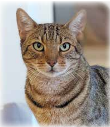
ARTGERECHT TIERSCHUTZ E. V. (PM). Unser Rio (Bengal-Mix-Kater, geboren 07/2019, kastriert) sucht

sein Glück – und vor allem sucht er die Freiheit! Er hat gerade den Freigang für sich entdeckt und genießt es sichtlich, durch die Nachbarschaft zu streifen. Um die angespannte Atmosphäre zu Hause zu entspannen, wurde Rio der Freigang ermöglicht. Dort lebt er mit seiner Schwester zusammen und harmoniert gerade nicht so gut. Früher haben sich die beiden wunderbar verstanden, doch inzwischen kracht es immer häufiger zwischen ihnen. Das sorgt für Stress bei allen Beteiligten.