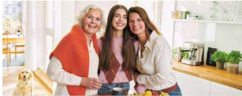
Je nach Alter und persönlicher Lebenssituation kann der Bedarf an Mineralstoffen wie Magnesium unterschiedlich sein.

Heute weiß man zum Beispiel, dass ein niedriger Magnesiumspiegel zu kardiovaskulären Problemen führen kann. Herzstolpern, Herzsrasen oder unregelmäßiger Herzschlag