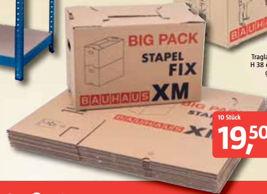
Umzugskarton 'Multibox X' Traglast 30 kg, L 62,5 x B 34,5 x H 38 cm, Volumen von 82 l, aufgedruckte Aufbauanleitung 10733102