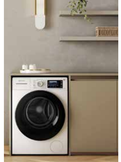
Leise laufende Waschmaschinen tragen dazu bei, dass man Freiräume, die sich durch den Einsatz moderner elektrischer Haushaltsgeräte ergeben, auch wirklich entspannt nutzen kann.

den herkömmlichen Riemenantrieb ersetzt. Die Trommel wird direkt angetrieben, was zu weniger Vibrationen und einer geringeren Schleuderdrehzahl führt. Die Dynamic Intelligence Technologie beinhaltet eine automatische Beladungserkennung, die gewährleistet, dass nur soviel Energie und Wasser wie erforderlich verwendet wird. Sie sorgt nämlich dafür, dass der Wasser- und Energieverbrauch an die tatsächliche Beladungsmenge der Waschtrommel angepasst wird. Bei jedem Waschgang kann so bis zu 45 Prozent Energie eingespart werden. Das ergaben Tests im Kurz 45-, Baumwolle-, Mischwäsche- und ECO 40 bis 60-Programm mit und ohne Dynamic Intelligence Technologie. Der funktionale Stil der Waschmaschine wird durch deutlich sichtbare Programme rund um den intuitiven Drehknopf ergänzt. Ein großes LCD-Display unterstützt bei der Navigation und zeigt den Programmstatus übersichtlich an.