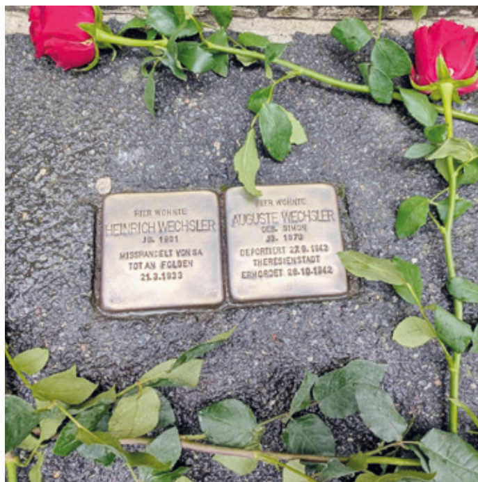
Zu Ehren der Arheilger Opfer des Nationalsozialismus wurden die Stolpersteine entlang der Stationen des Rundgangs geputzt und Rosen niedergelegt.