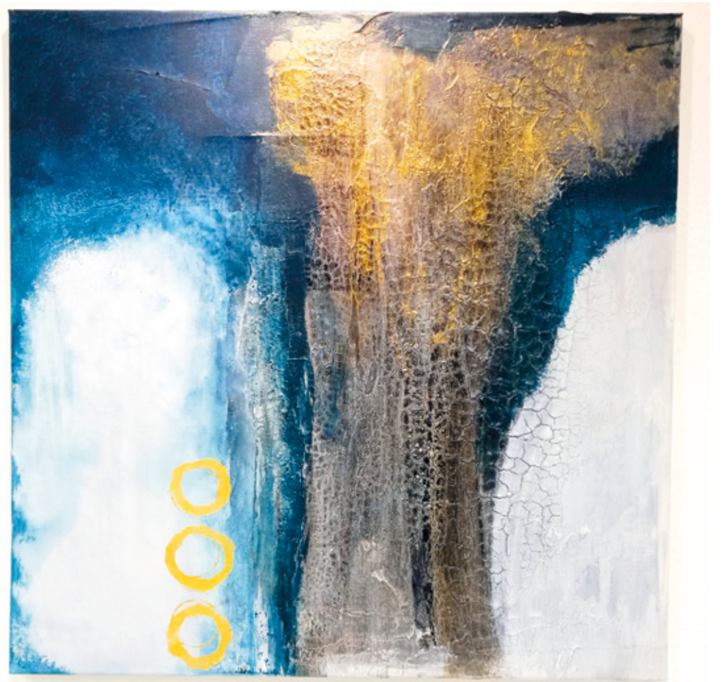
Mit Rost lassen sich faszinierende Bilder gestalten. Im Workshop des kunstWERK lernt man, wie das geht.

Wixhausen (jv). Eindrucksvoll und faszinierend: Wer künstlerisch mit Rost experimentieren möchte, hat im Atelier kunstWERK in Darmstadt-Wixhausen demnächst die Gelegenheit dazu: Am 22. und 23. November veranstaltet die Darmstädter Künstlerin Sabine Beckhaus einen spannenden Workshop, in dem die Teilnehmenden dem Rost in Kombination mit Farbe,