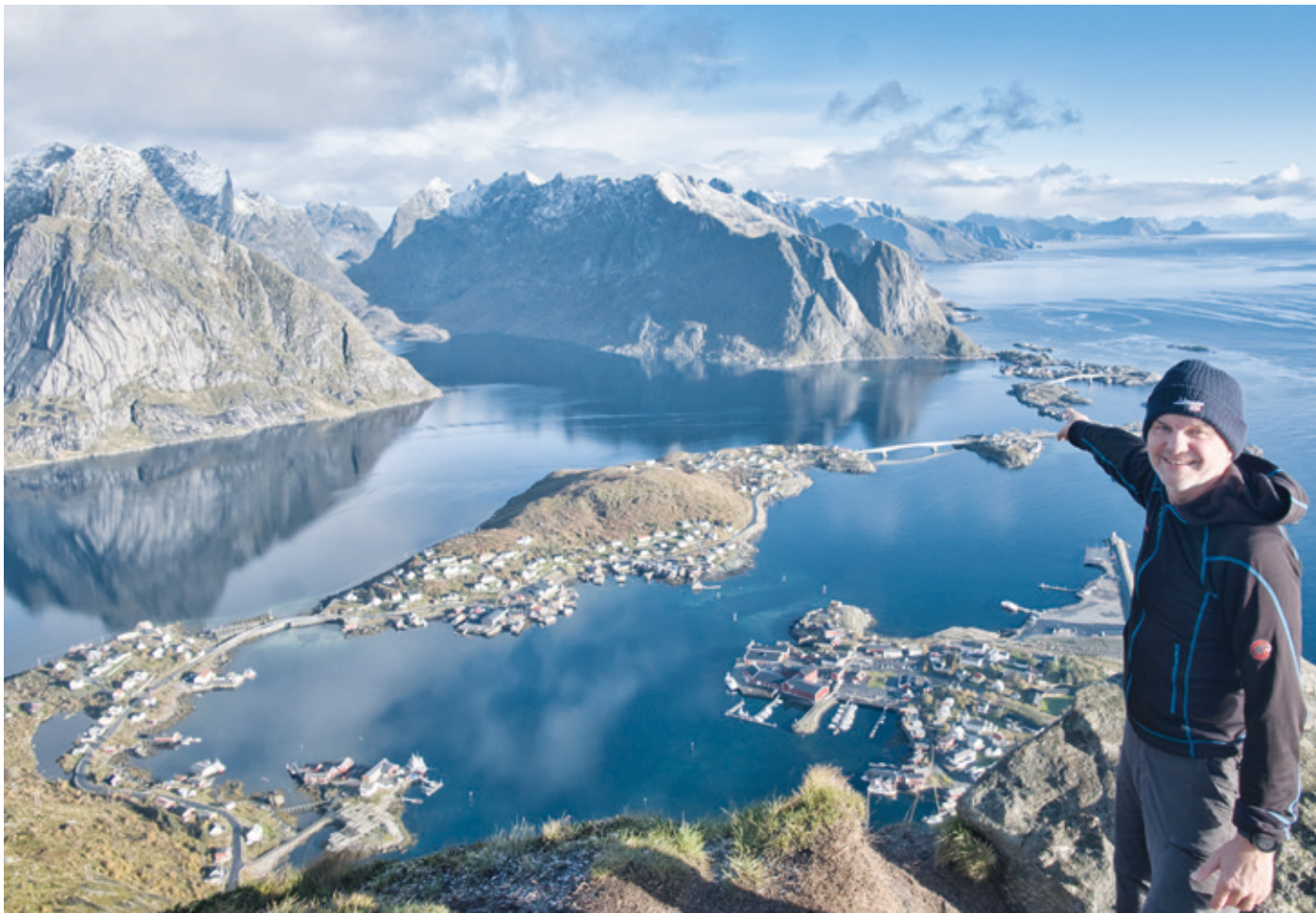
Aussicht auf Hamnøy – nach 1.978 Stufen Aufstieg auf den Reinebringen (442m).

Zusatzveranstaltung der neuen Live-Reportage von Stefan Seibold am Samstag, 29. November 2025 um 19:30 Uhr im Bücherbahnhof Erzhausen