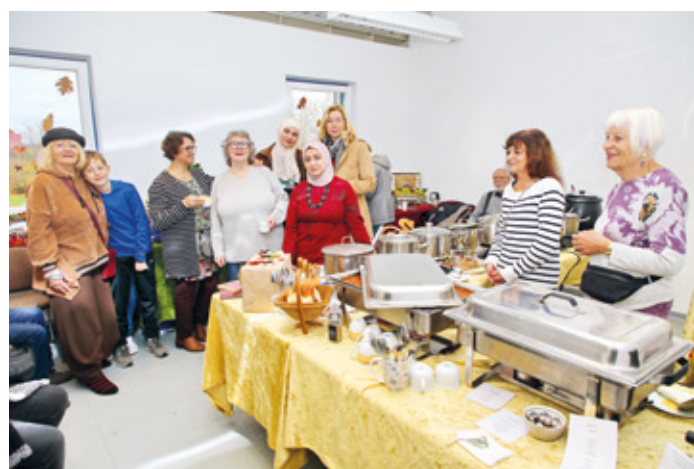
Die 15 verschiedenen Suppen wurden von allen Gästen mit großer Begeisterung probiert. Dabei entwickelte sich eine rege Unterhaltung bei gelöster Stimmung.

Dabei ist klar: bei „Kleider-und-Mehr-Erzhausen“ kann sich jeder etwas Passendes aussuchen. Hier wird kein Un-