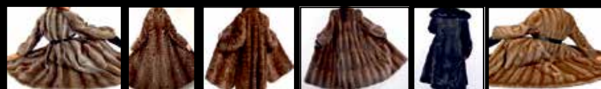
Bisam • Persianer • Fuchspelze aller Art • Zobel • Nerze • Nutria • Chincilla