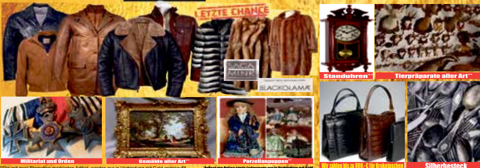
Militärat und Orden, Gemälde aller Art, Porzellanpuppen, Wir zahlen bis zu 800,- € für Brillenfasschen, Silberbesteck

Ankauf von Lederjacken, Ledermäntel und Lederhosen aus Glatt- und Wildleder, auch Lammfellmäntel zum Höchstpreis bis zu 3.500 €*