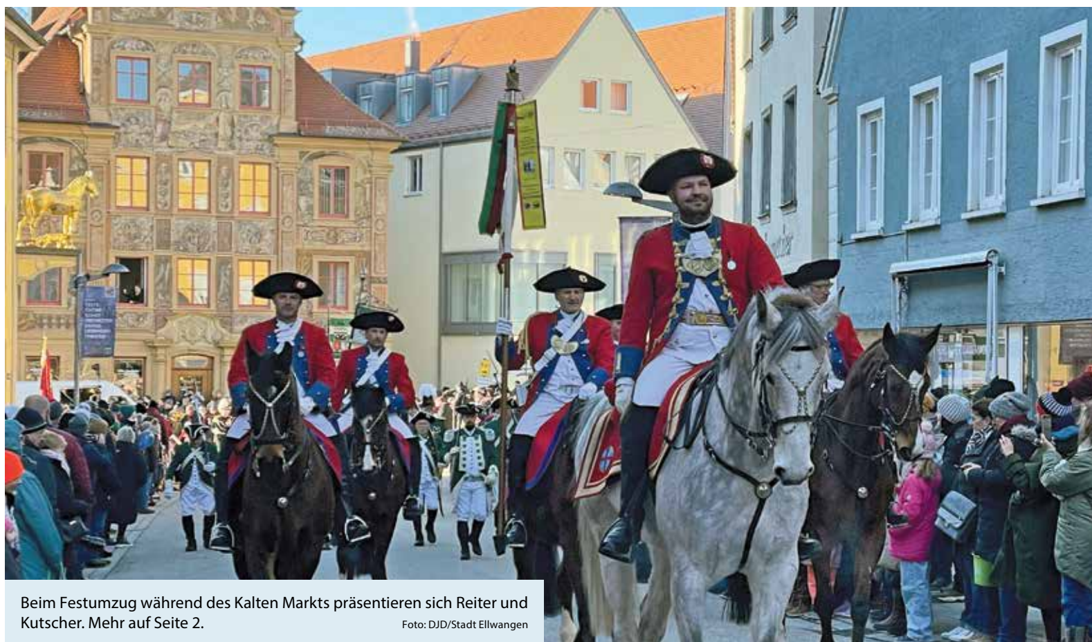
Beim Festumzug während des Kalten Markts präsentieren sich Reiter und Kutscher. Mehr auf Seite 2.