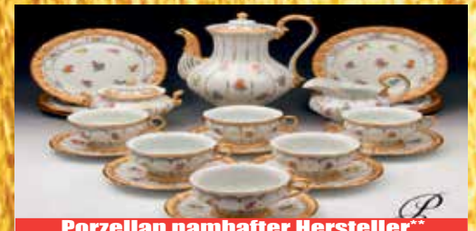
Porzellan namhafter Hersteller**