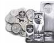
Silbermünzen und -barren