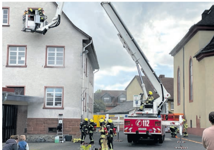
Personenrettung über den Teleskopmast.

Alarmiert waren nicht nur die Kräfte aus Münster und Altheim, auch der Ortsverband des Deutschen Roten Kreuzes nahm an der Übung teil. Simuliert wurde ein Brand im Gebäude mit mindestens 10 vermissten Personen. Diese befanden sich zum Großteil noch im Gebäude und mussten gerettet werden. Nach der Erkundung der Lage wurde alles vorbereitet, um schnell mit der Menschenrettung zu beginnen. Dabei wurde parallel an mehreren Stellen gearbeitet. Während Trupps unter Atemschutz in das Gebäude vorgingen, wurde der Teleskopmast in Stellung gebracht, um Personen aus den Fenstern höherer Stockwerke zu retten. Wiederum andere Trupps ret-