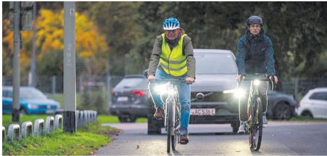
Reflektierende Accessoires oder Warnwesten verhelfen zu mehr Sichtbarkeit.