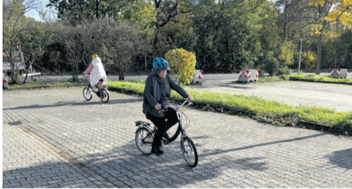
Die Frauen-Fahrradkurse in Heusenstamm waren ein voller Erfolg.

Die Kurse wurden vom Integrationsbüro der Stadt organisiert und von der Radfahrerschule Open Mobility Services, ein Partner des Allgemeinen Deutscher Fahrrad-Club Landesverband Hessen e. V. (ADFC), umgesetzt. Im Anschluss erhielten die Teilnehmerinnen von den Fahrradschraubern der ehrenamtlichen Flüchtlingshilfe noch eine kurze Einführung zu den Themen Fahrradsicherheit und Reparaturen. Hier konnten die Frauen auch ein gebrauchtes Rad erstehen, um die neu erworbe-