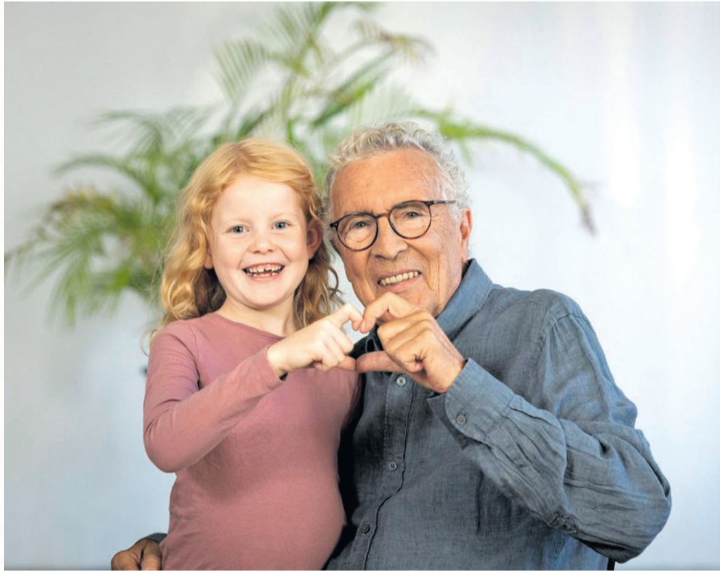
Für eine unbeschwertere Winterzeit mit den Enkeln sollten sich Großeltern - und alle anderen ab 60 Jahren - gegen die Grippe impfen lassen.

Die Ständige Impfkommission (STIKO) empfiehlt die jährliche Grippeimpfung für alle Menschen ab 60 Jahren sowie alle Personen mit Herz-Kreislauf-Krankheiten. Auch bei chronischen Grunderkrankungen etwa der Atemwege, der Leber und der Nieren, bei Diabetes und Multipler Sklerose sowie Immunschwäche gilt diese Empfehlung. Am besten erfolgt die Impfung bis Mitte Dezember. Da die Grippefälle aber nach dem Jahreswechsel oft besonders stark ansteigen, ist auch jede spätere Impfung bis ins Frühjahr hinein noch wichtig und sinnvoll. Daher sollte man am besten zeitnah einen Termin in der Arztpraxis oder Apotheke vereinbaren.