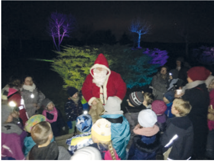
Alle Jahre wieder kommt der Blaulichtnikolaus zu den Erzhäuser Kindern.

Erzhausen (stm). Am Samstag, den 06.12., von 17-19:30 Uhr, wird es um die Erzhäuser Grillhütte wieder festlich beleuchtet sein, nach Punsch und Waffeln duften und vorweihnachtliche Töne erklingen. Die Erzhäuser Blaulichtretter vom DRK und der Feuerwehr laden Euch, liebe Erzhäuser Kinder, Eltern, Großeltern, Groß & Klein zu einem vorweihnachtlichen Abend ein. Genießt die Stunden gemeinsam mit Freunden an der Grillhütte und wartet zusammen auf die Ankunft des Blaulichtnikolaus.