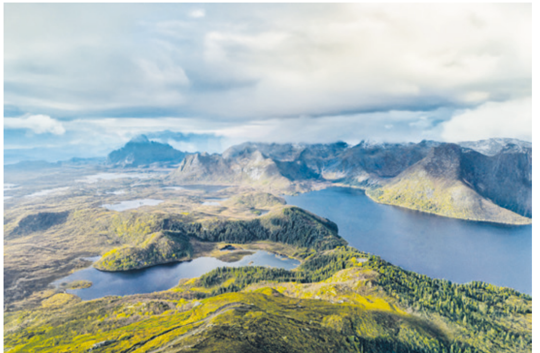
Die Aussicht nach 1.978 Stufen Aufstieg auf den Reinebringen (442m).