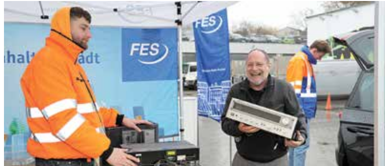
Eine komplette, geliebte Stereoanlage wanderte in die Annahme.

Eine Frau aus Hausen brachte einen noch funktionierenden Mixer, ein Frankfurter übergab seine alte, noch intakte Stereoanlage mit Kassettendeck und Plattenspieler. Die erste Frage ist immer: „Funktioniert das noch oder geht das direkt weg?“ Im Raum hinter der Übergabe sor-