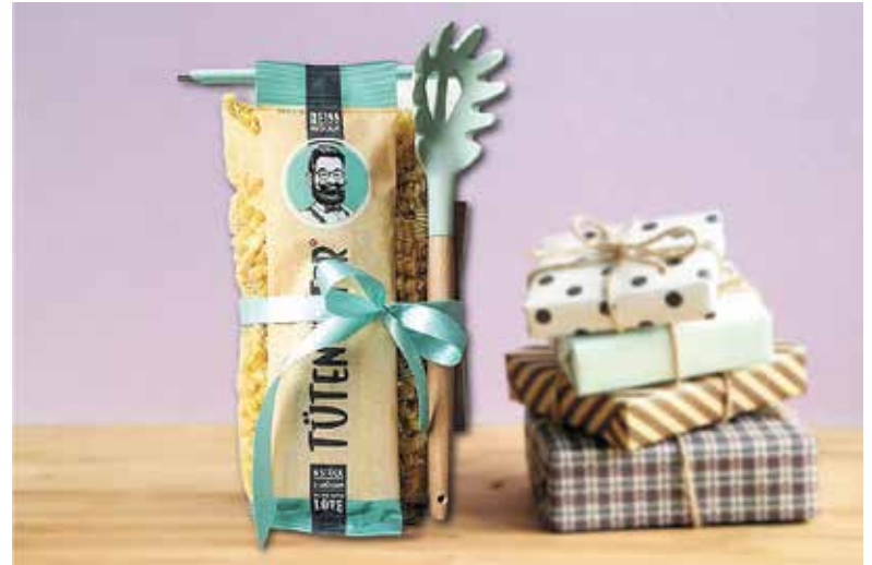
Geschenke, die nicht nur stylisch, sondern auch praktisch sind, kommen immer gut an.

Gerade beim Schenken ist es daher umso wertvoller, Nützliches mit Schöнем zu verbinden. Selbst gemachter Sirup oder ein Gewürzöl, wiederverwendbare Trinkflaschen aus Glas oder Edelstahl oder ein duftendes Duschgel sind nur einige Ideen. Wer einem Genießer oder Hobbykoch eine Freude machen möchte, kann mit hochwertigen Küchenutensilien wie Geschirrtüchern aus Leinen oder einer eleganten Bratenzange besonders punkten. Für mehr Nachhaltigkeit bieten sich beispielsweise die cleveren Tütenhüter von böörds an. Dieses stabförmige Verschlusssystem eignet sich für nahezu jede Art von ge-