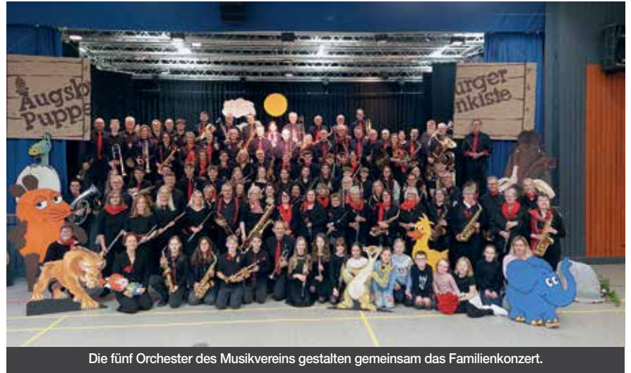
Die fünf Orchester des Musikvereins gestalten gemeinsam das Familienkonzert.

Fünf Orchester nehmen Zuhörer mit auf eine musikalische „Freundschaftsreise“