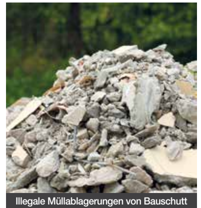
Illegale Müllablagerungen von Bauschutt