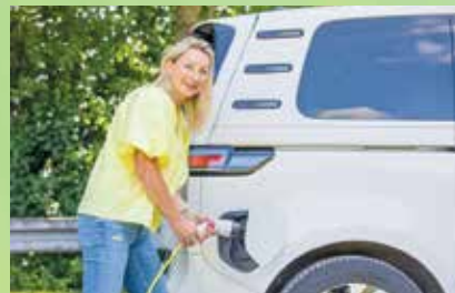
Moderne E-Autos fahren heute oft über 400 Kilometer – und laden dank Schnelllader in kurzer Zeit wieder auf.

Manche zweifeln an Reichweite oder Ladefrastruktur, andere fürchten hohe Kosten. Studien und Erfahrungen zeigen, dass viele Sorgen überholt