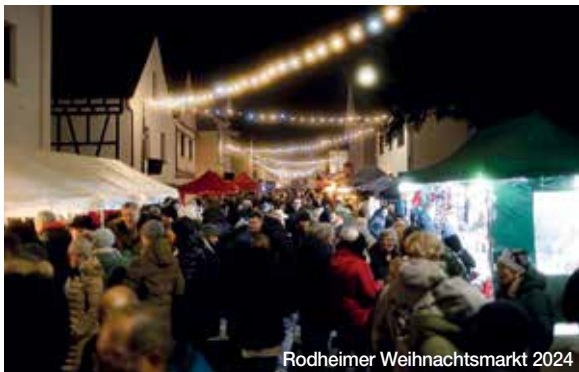
Rodheimer Weihnachtsmarkt 2024

Nah - Kompetent - Günstig 24 Stunden Notdienst