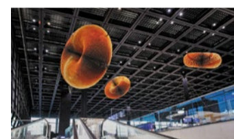
Drei tonnenschwere Skulpturen bilden Gesamtkunstwerk von Julius Bismarck.

FLUGHAFEN (RED) | Fraport hat die Kunstinstallation vorgestellt, die künftig die Check-in-Halle des neuen Terminal 3 prägt: „The First, the Last, Eternity“ von Künstler Julius von Bismarck. Das Werk besteht aus drei imposanten, ringförmigen Skulpturen mit Durchmessern von drei, fünf und sieben Metern und einem Gewicht von bis zu drei Tonnen. Gefertigt aus 636 eingefärbten Aluminiumscheiben, zeigen die drei verschiedene Reliefstrukturen – darunter die Topogra-