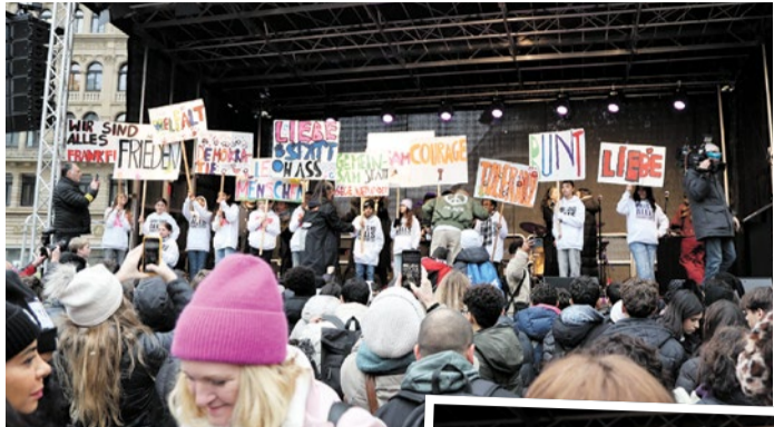
Impressionen der musikalischen Kundgebung.

Eindrucksvolle Kundgebung auf dem Opernplatz