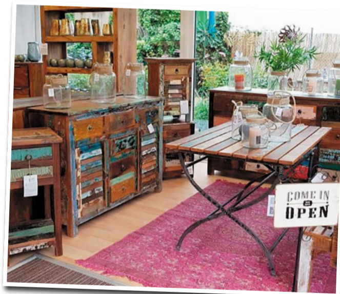
fischer's LAGERHAUS macht das Zuhause besonders

Wenn ihr Lust habt, eurem Zuhause einen Hauch Fernweh zu verpassen, solltet ihr unbedingt bei fischer's LAGERHAUS in Bergen-Enkheim vorbeischaun.