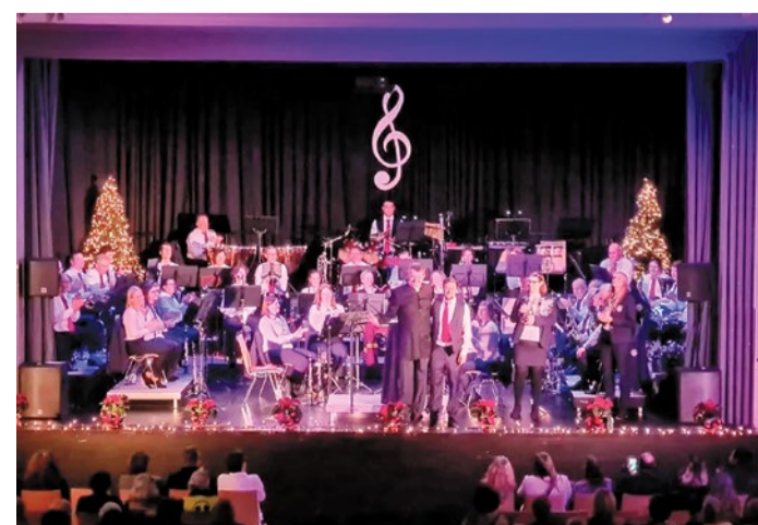
Die Stadtkapelle Bergen-Enkheim für einen musikalischen Adventsabend