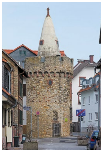
Einst Teil der Stadtbefestigung, heute ein beliebtes Fotomotiv

Der Weiße Turm ist ein echtes Stück Mittelalter mitten in Bergen-Enkheim. Der spätgotische Wehrturm stammt aus dem Jahr 1472 und war einst Teil der mächtigen Stadtbefestigung von Bergen – die anderen Mauern und Tore sind längst verschwunden. Wenn man heute durch die Gangstraße schlendert, fällt der