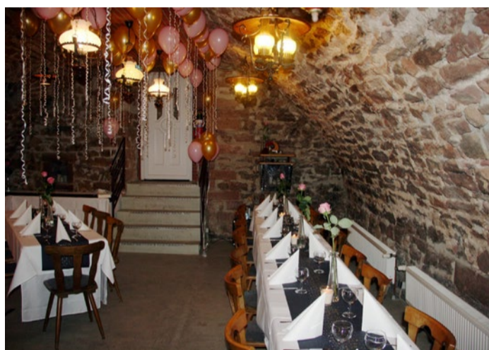
Der gemütliche Gewölbekeller des Restaurants

Das Gasthaus „Zum Lemp“ ist nicht nur eine von Berkersheims traditionsreichste Adresse, sondern seit Generationen ein Ort der Begegnung, an dem Einheimische und Gäste ganz selbstver-